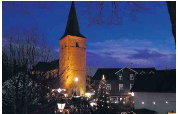
Wir laden wieder ein zur Dörper Weihnacht.

Abbau der „DörperWeihnacht“: Montag, 8. Dezember, 8:30 Uhr (Ev. Kirche)