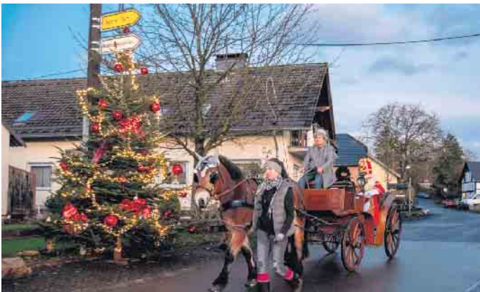
Der Nikolaus unterwegs