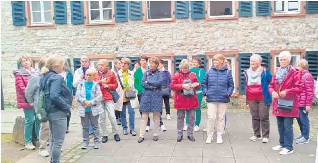
Führung Papiermuseum Bergisch-Gladbach