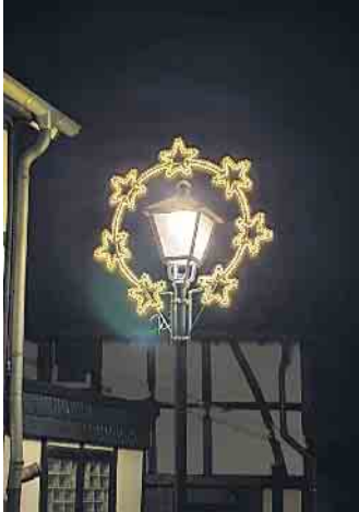
Die Hauptstrasse wird erleuchten...

bach) und Friends“ und Ihnen Weihnachtslieder anstimmen und die Adventszeit einläuten.