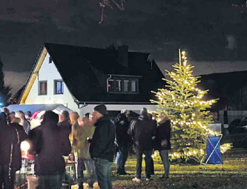
Impressionen vom letzten Jahr

Zu unserem abgewandelten Vereinsmotto „Mach mit“ laden wir am Samstag den 25. November