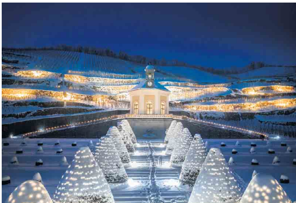
Europas erstes Erlebnisweingut leuchtet im Winter im Lichterglanz.

Wie ein Raugraf den Glühwein in Sachsen erfand