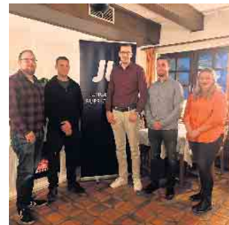
Der neue JU Vorstand