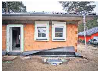
Wegen hoher Kosten, der Inflation und den Unsicherheiten der Energiemärkte verschieben viele Bauwillige mit mittleren Einkommen ihre Baupläne auf unbestimmte Zeit.

ten Spatenstich bis zur Bauabnahme flankiert und dabei hilft, am Ende ein weitgehend mängelfreies und dem geschlossenen Vertrag entsprechendes Haus zu bekommen. (DJD)