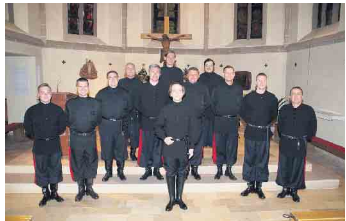
Die Original Don Kosaken (R) aus der Ukraine gastieren am 2. Dezember in Eitorf.

tionen der Tournee. Karten können zum Preis von: 22 Euro in Eitorf bei Zigarren Lichius (Am Markt 19), unter