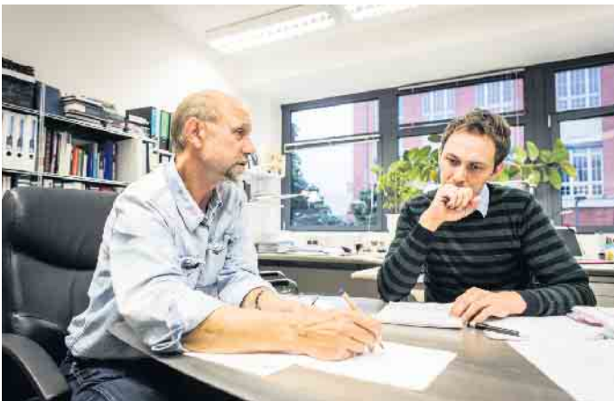
Um das beste Bauunternehmen aus verschiedenen Angeboten herauszufiltern, können künftige Bauherren den Rat unabhängiger Bauherrenberater in Anspruch nehmen.