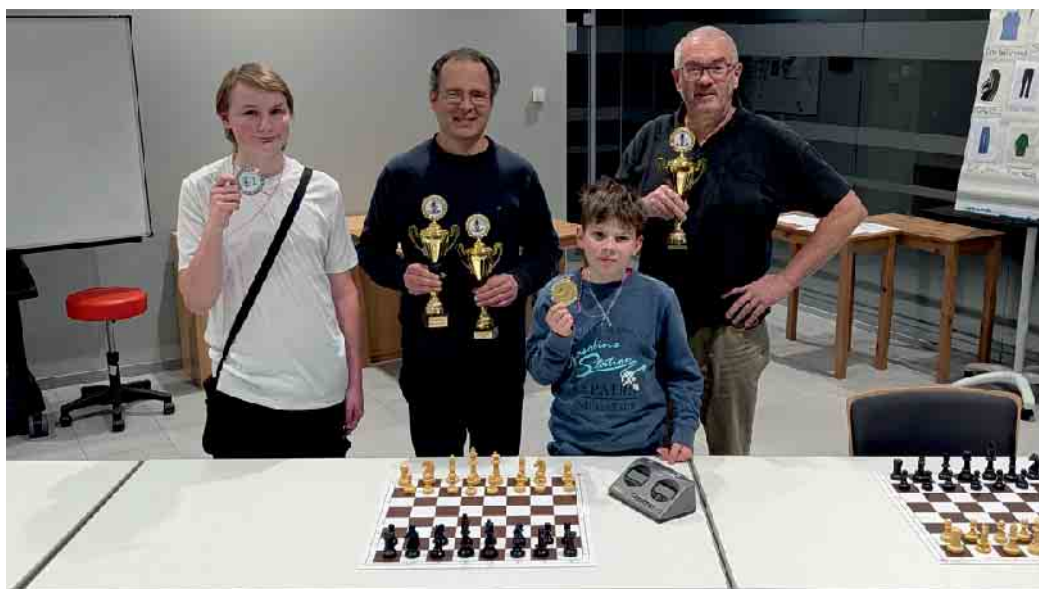
Die glücklichen Preisträger.

Der SC Turm Windeck führte am Sonntag, 26. Oktober, sein Vereinsblitzturnier 2025 durch. Teilnahmeberechtigt waren neben den Vereinsmitgliedern auch alle Gäste der Spiel- und Trainingsabende. Es wurde mit der klassischen festen Blitzbedenkzeit von 5 Minuten je Spieler/Partie gespielt. In zwei Durchgängen spielte jeder Teilnehmer jeweils gegen jeden anderen Teil-