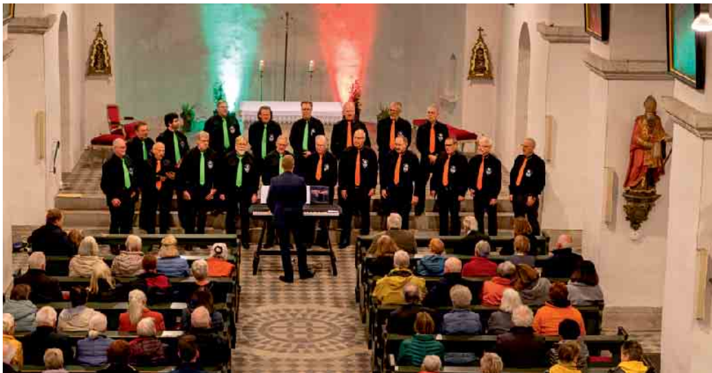
Der Chor beim Herbstkonzert im letzten Jahr.