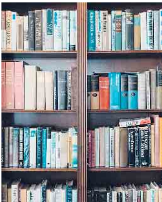
Das Bücherei-Team freut sich auf Sie!

In Büchern stöbern, Kaffee trinken, lecker Kuchen essen und eine Malaktion für Kinder. Ev. Gemeindehaus „Die Arche“ 9. November 11 bis 16 Uhr Interessierte erwartet eine vielfältige Auswahl an gespendeten und ausrangierten Büchern, CDs, DVDs und vielem mehr, für Kinder sowie Erwachsene - und das zu kleinen Preisen. Der Erlös aus dem Flohmarkt und der Cafeteria kommt der Bücherei zugute.