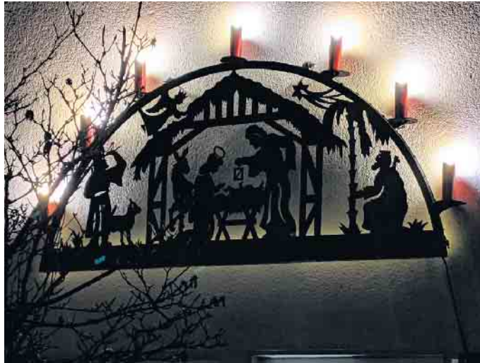
27. Döörper Weihnacht

Weihnachtsbäume mit Schleifen schmücken: