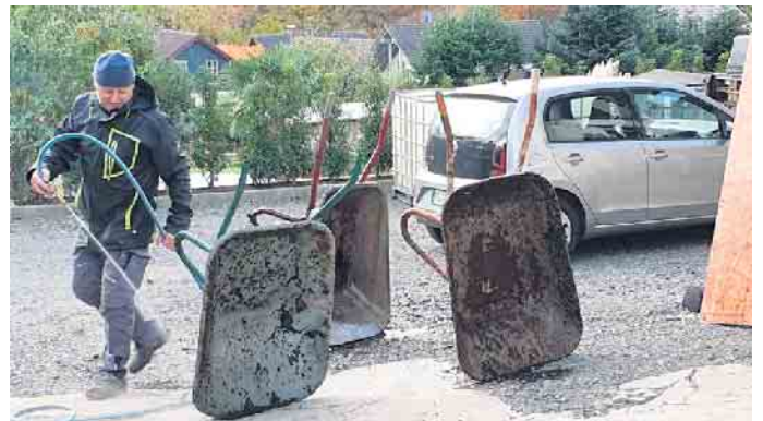
„Mach mit“ für unsere Heimat