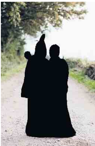
Kinderprinzenpaar Tanzgruppe Rot Weiss Häscheid

uns auf Euch! Heimatverein Häscheid Abteilung Tanz