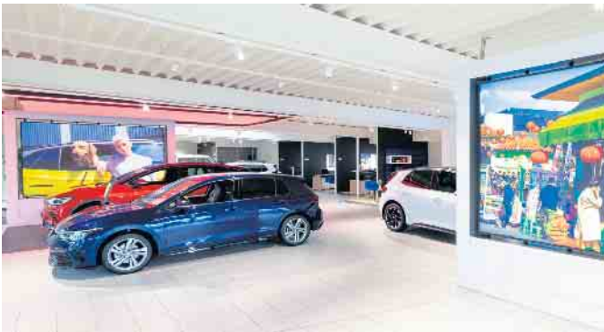
Die Verkaufsfläche bei Auto Thomas in Hennef wurde neu gestaltet und erstrahlt in attraktivem Design

Was macht die Firmengruppe Auto Thomas und damit auch den Hennefer Standort aus?