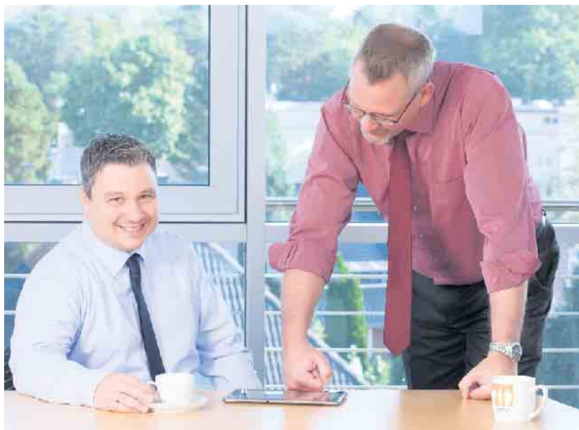
Immer häufiger wenden sich Jobsuchende an qualifizierte Personaldienstleister, die nicht nur Zeitarbeit anbieten, sondern Bewerbern auch dabei helfen, eine Festanstellung zu finden.