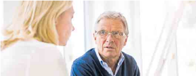
Sowohl bei Vermietern als auch bei Mietern herrscht oft Unkenntnis zu den jeweiligen Rechten und Pflichten. Und das, obwohl der Anteil der Mietwohnungen in Deutschland überdurchschnittlich hoch ist.

der Lage ist, die Wartung regelmäßig durchzuführen. Und er muss prüfen, ob der Mieter der Pflicht nachkommt. Viele Vermieter beauftragen deshalb Dienstleister mit der Übernahme der Wartung. (DJD)