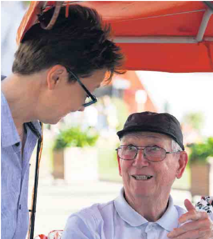
Senioren-Assistenten sind Ansprechpartner und qualifizierte Begleiter durch den Alltag älterer Menschen.