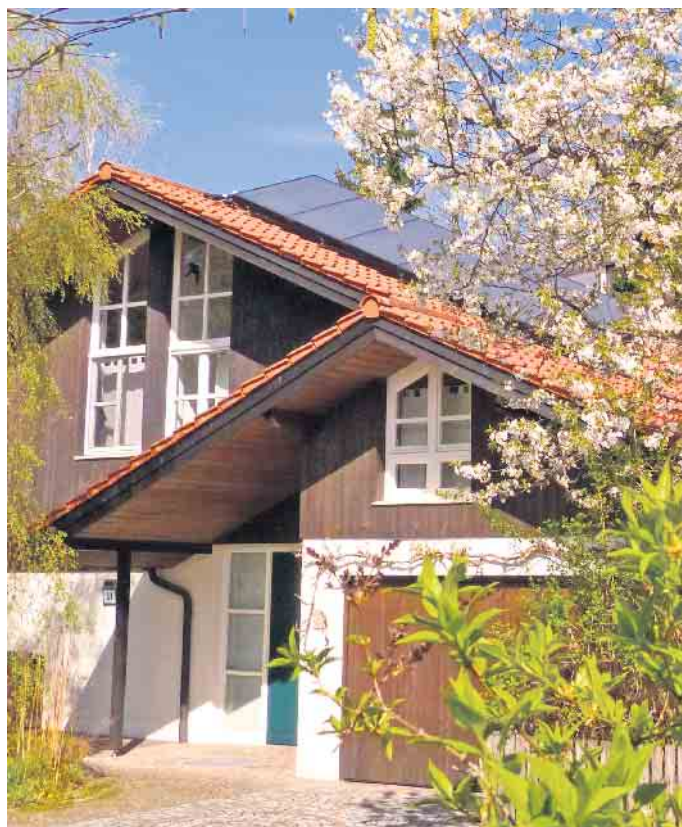
Viele Menschen in Deutschland wohnen in älteren Ein- und Zweifamilienhäusern, in denen früher oder später Sanierungen anstehen.