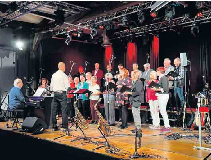
„Ein bisschen Frieden“ sang unser Chor zu Beging seiner Darbietung in der Kabelmetal.