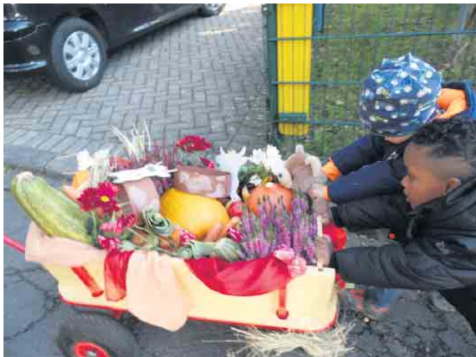
Unsere Bollerwagen mit dem geernteten Obst und Gemüse

Nach dem Gottesdienst wurde auf den Kirchplatz der/die Kartoffelkönig/in gekrönt. Dieses Jahr erhielt die schwerste und die außergewöhnlichste Kartoffel eine Krone und ein Geschenk. Das Lied „Wenn die Kartoffel nicht wäre“ beendete das Krönungsfest und wir zogen mit unseren Bollerwagen wieder zurück in den Kindergarten, wo wir uns die selbstgekochte Suppe gut schmecken ließen.