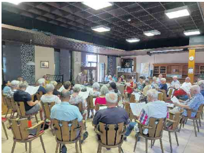
Unser erster Mitsingabend nach der Sommerpause

Zum letzten Mal vor unserem großen Jubiläumsjahr 2023 laden wir Sie herzlich zu unserem Mitsingabend ins Eitorfer Sängerheim ein. Das gewählte Thema „Sankt Martin“ ist dabei nur eines von mehreren Themenblöcken, die wir gemeinsam mit ihnen singen möchten. Der Herbst und der anstehende „jecke“ 11.11. werden nicht ausgespart. Mit diesem bunten musikalischen Strauß heißen wir Sie bei freiem Eintritt und einer hübschen kleinen Überraschung am 10. November, 19 Uhr im „Gasthaus für Chöre“ willkommen.