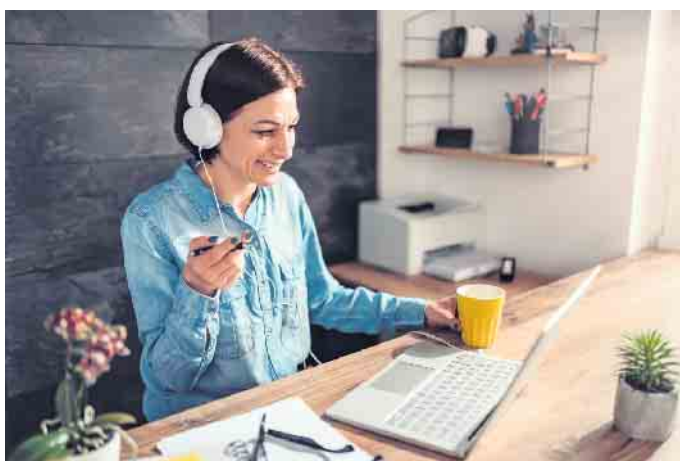
Online-Coaching ist spätestens seit der Pandemie zu einer beliebten Form des Austauschs geworden.

Ein professionelles Coaching kann beispielsweise mit einem sogenannten „Aktivierungs- und Vermittlungsgutschein“ (AVGS) vom Jobcenter oder von der Agentur für Arbeit finanziert werden. Diesen kann man bei zertifizierten Anbietern einlösen. Voraussetzung dafür ist, dass man arbeitssuchend oder von Arbeitslosigkeit bedroht ist. Das kann zum Beispiel auch Hochschulabsolventen, Berufsrückkehrer und Selbstständige betreffen. (djd)