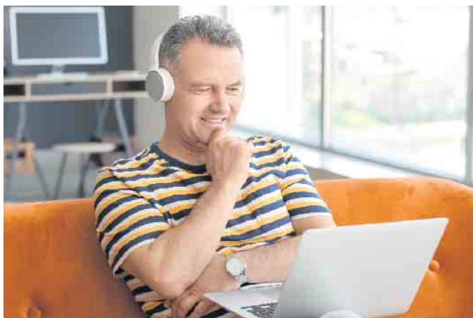
Beim Online-Coaching wird mithilfe erprobter, kreativer Methoden der individuell passende Lösungsweg bei der Jobsuche gefunden.