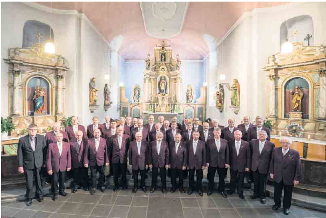
Der Männergesangsverein in der Kirche St. Servatius

sam mit Ihnen einen Nachmittag in festlicher Umgebung bei ausgewähltem Chorgesang