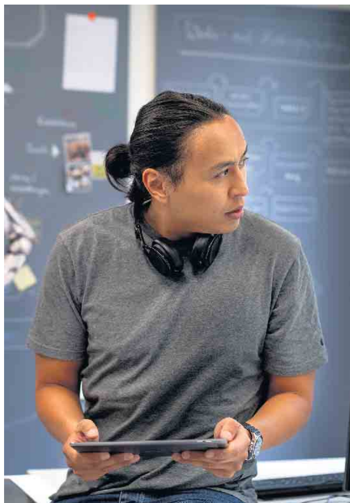
Technologisches und digitales Fachwissen erwerben - mit dem Master „Business Transformation Management“.