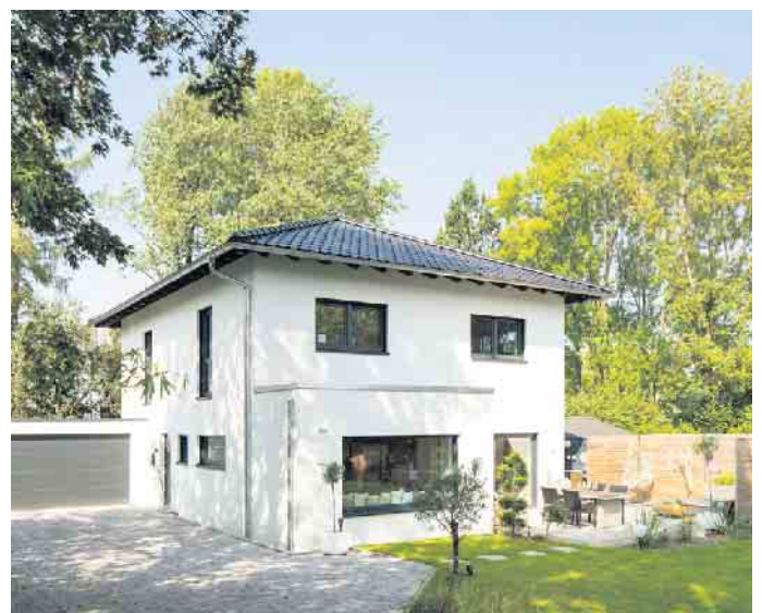
Die hohe Energieeffizienz moderner Holz-Fertighäuser hilft der Umwelt und spart Energiekosten.