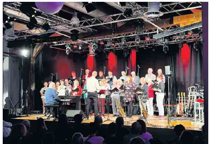
Zum Abschluss erklang „I sing a Liad für di“.