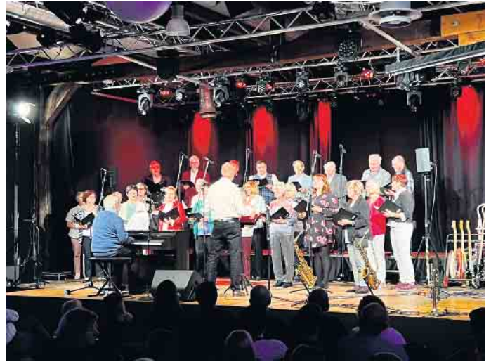
Unser Chor sang als zweiten Liedbeitrag „Barbara Ann“.

Auf dem Weg zum 150. Vereinsjubiläum war es für unseren Chor eine gute Übung, am 30. Oktober in der Windecker Kulturfabrik Kabelmetal drei Liedvorträge aus unterschiedlichsten Genres zu intonieren.