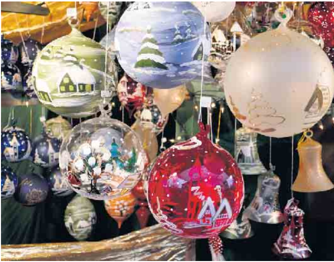
Döörper Weihnacht.

11 bis 19 Uhr Merken Sie sich diesen Termin unbedingt vor. Das Rahmenprogramm und weitere wichtige Informationen werden wir später veröffentlichen. Aktualisierte Informationen finden Sie jederzeit auf unserer Homepage ( www.bv-ruppichterorth.de ).