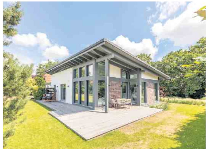
Fertighäuser werden nach den individuellen Wünschen und Bedürfnissen des Bauherrn geplant - vom kompakten Bungalow bis hin zur großen Stadtvilla.

tighauses dokumentiert. „Das QDF-Siegel ist eine sichere Vertrauensbasis für Bauherren, auf der ein Fertighausbau gründet“, erklärt Achim Hannott, Geschäftsführer des Bundesverbandes Deutscher Fertigbau (BDF). Darüber hinaus werden beim Fertighausbau viele natürliche und energiesparende Materialien genutzt, die das Haus insgesamt zu einem Energiesparhaus machen: Der wichtigste Baustoff Holz hat eine sehr gute Umweltbilanz, da er von Natur aus eine hohe Wärmedämmung bietet. Dazu werden gezielt Dämmstoffe in der Wand verarbeitet, durch die beim Bewohnen und Heizen des Hauses viel Energie gespart werden kann. Ebenfalls gut für die Umwelt und das Klima ist,