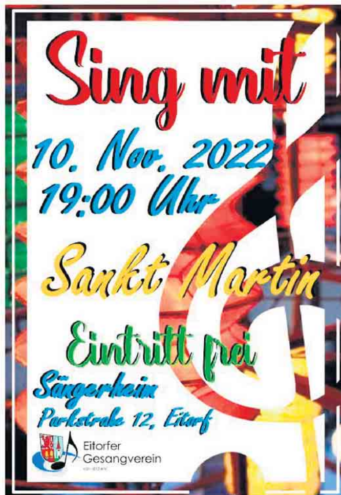
Unser Plakat zum Mitsingabend - herzliche Einladung.

etwas Großes bei uns zu feiern! „Seit 150 Jahren singen wir Lieder für Euch!“, unter diesem Grundgedanken feiern wir ein starkes Jubiläumsjahr, mit unterschiedlichsten Angeboten und Genres. Vom karnevalistischen Mitsingabend unter Beteiligung des Eitorfer Prinzenpaares, über eine Matinee für aktive Sänger/innen und geladene Gäste unter Schirmherrschaft von Bürgermeister Viehof, ein Jubiläumskonzert, Freundschaftssingen, am ehren-den Volkstrauertag und einem Adventskonzert mit den Don Kosen würden wir Sie und Euch herzlich und musikalisch in unserer Mitte wissen. Und zwei Dinge sind dabei gewiss; „Spaß an d'r Freud und dem Gesang“ und eine bunte, ausgewogene und abwechslungsreiche Chorliteratur, in der