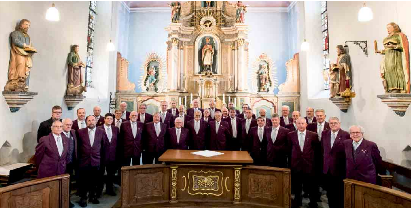
Der MGV „Sangeslust“ Winterscheid in der Kirche St. Servatius

Benefizkonzert des Männergesangsvereins „Sangeslust“ Winterscheid