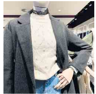
Tolle Mode auf größerer Fläche erwartet Sie im neuen ONLY.

Und damit Sie immer aktuell informiert sind über die huma Shoppingwelt, alle Events, Aktionen, Angebote und Gewinnspiele, folgen Sie doch der huma auf Facebook oder Instagram unter @humaSanktAugustin. Oder schauen Sie einfach regelmäßig auf der Website huma.de in den News vorbei. Die huma freut sich auf Ihren Besuch - virtuell auf den digitalen Medien und am liebsten persönlich im Center in Sankt Augustin!