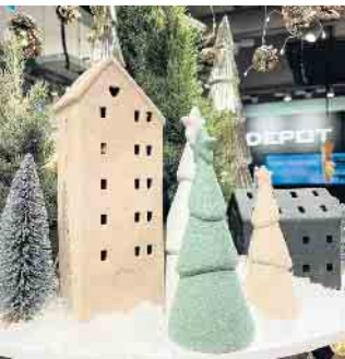
Im neuen Depot auf der Straßenebene wird jeder Dekofan fündig!

Auch der Fashionstore ONLY hat sich neu erfunden! Mit einer großzügigen Flächenerweiterung präsentiert der Laden nicht nur eine erweiterte Auswahl an trendiger Damenmode, sondern begeistert ab sofort auch kleine Mode-Enthusiasten mit seinen trendigen Kinderkollektionen - von lässiger Freizeitbekleidung bis zu bezaubernden Kleidern. Modebewusste Eltern