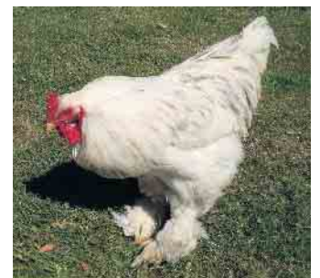
Hahn der Rasse Brahma

Wo: Sporthalle Schulzentrum Much, Fritz-Wilhelm-Straße, 53804 Much.