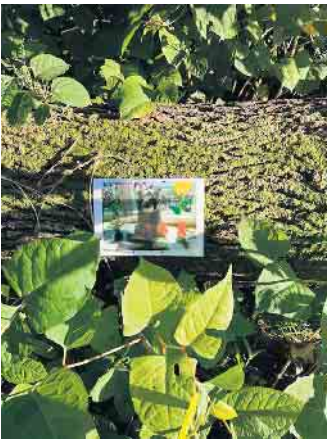
Ein Hinweis des versteckten Klassentieres.

Am vergangenen Samstag war es wieder so weit!