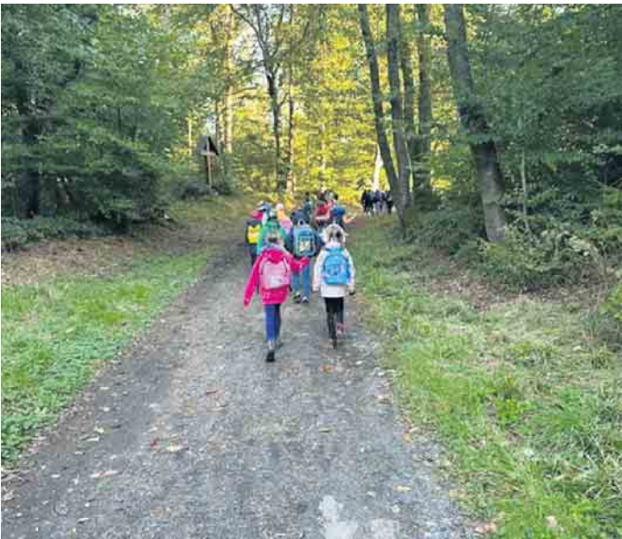
Und ab ging es in den Wald bei Winterscheid.

Essen und Trinken versorgt haben, den Eltern für ihre Fahr-Dienste sowie den beiden Fördervereinen für die Übernahme der entstandenen Kosten. So blicken wir auf einen rundherum gelungenen Wandertag zurück, den auch die Jüngsten mit Bravour gemeistert haben!