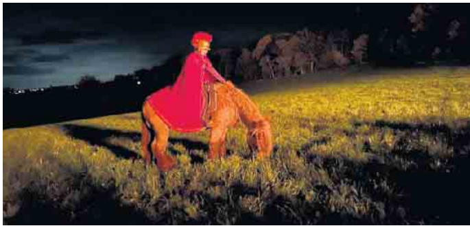
St. Martin auf dem Pferd

platz gehen. Die Kinder unserer Schule werden in den Herbstferien an ihren Türen klingeln um Weckmann-Bons zu verkaufen. Bitte unterstützen Sie diese besondere Tradition mit dem Erwerb der Bons und dem Schmücken Ihrer Häuser! Die Kinder sagen vielen Dank!