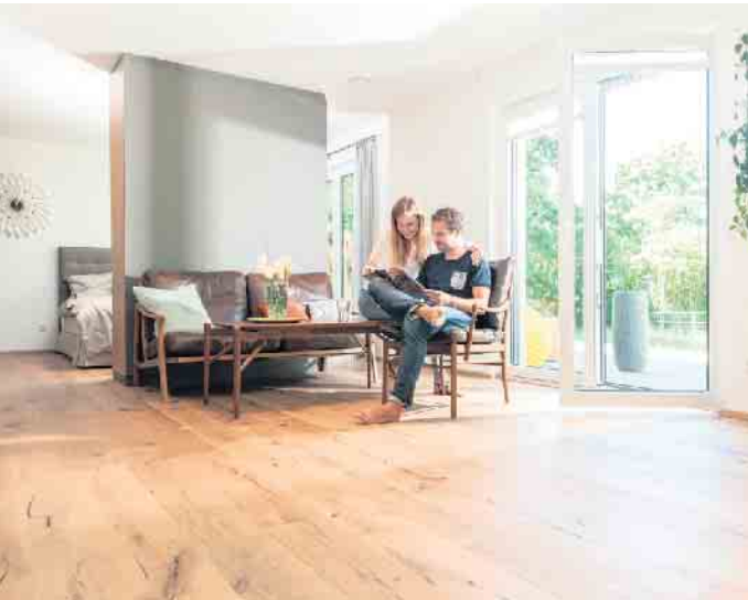
Derselbe Boden, komplett neue Optik: Erfahrene Parkettprofis können Echtholz-Beläge aufbereiten und vielseitig gestalten.

Parkettprofis können Bodenbeläge aus Holz aufbereiten und neu gestalten