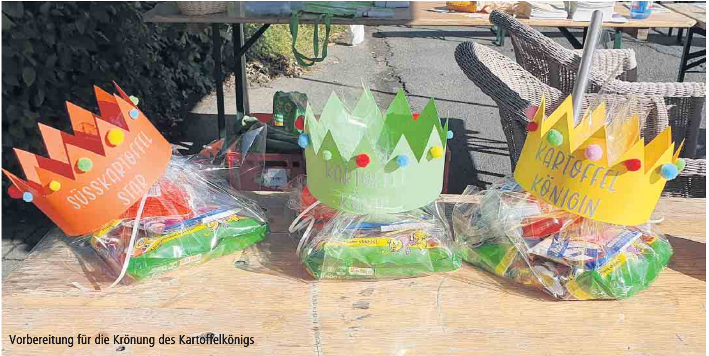
Vorbereitung für die Krönung des Kartoffelkönigs