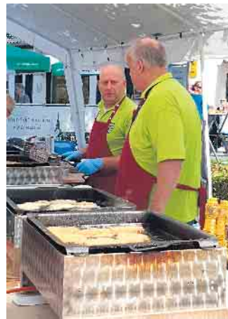
Alles bereit für den Ansturm