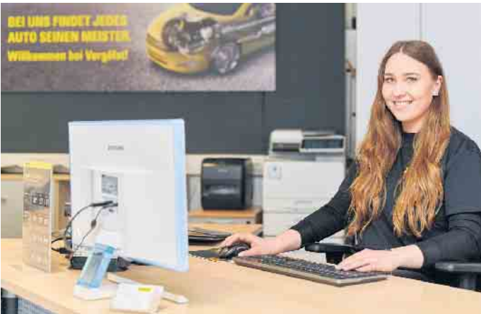
Kaufmännische Berufe in Kfz-Werkstätten sind bei jungen Menschen ebenfalls beliebt. Nach der Ausbildung bestehen sehr gute Übernahmechancen.

selbstständige, zuverlässige Arbeitsweise. Die Ausbildung dauert dreieinhalb Jahre, endet mit dem Abschluss an der regionalen Handwerkskammer - und bietet danach hohe Chancen auf eine Übernahme und weitere Karriereschritte.