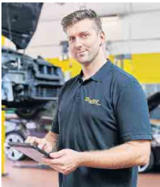
Kfz-Mechatroniker sind für Wartungs- und Reparaturarbeiten an allen gängigen Automarken und Fabrikaten verantwortlich.