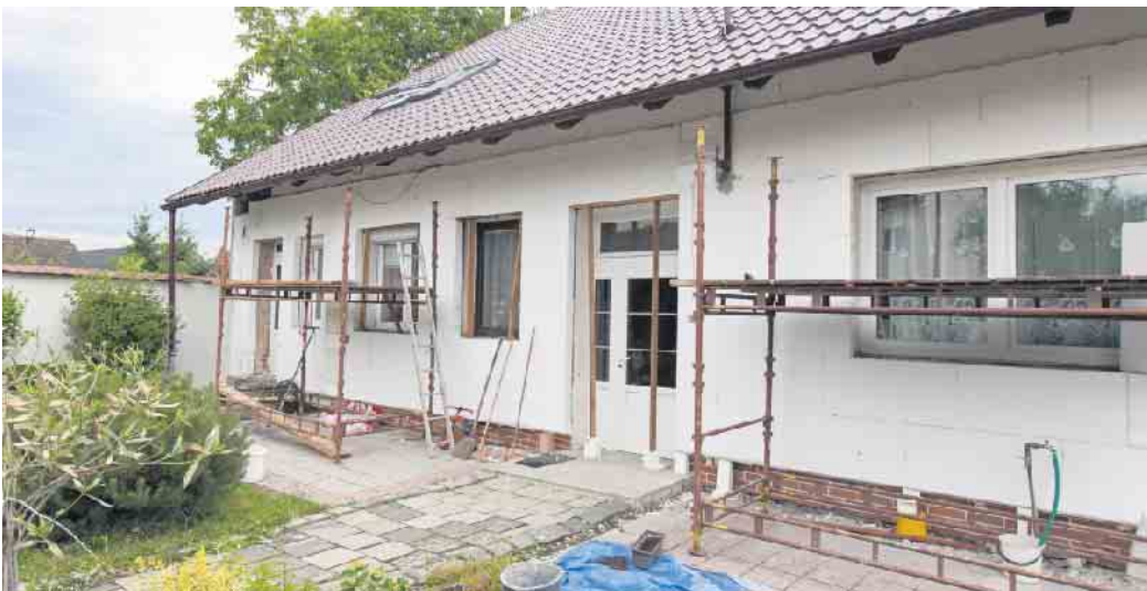
Für die Planung und Ausführung von Modernisierungen empfiehlt es sich, unabhängigen sachverständigen Rat einzuholen.

Unabhängige Bauherrenberater vom Bauherren-Schutzbund e.V. können Hausbesitzer dabei umfassend unterstützen. In einer Hausbegehung lässt sich der Modernisierungsbedarf ermitteln. Auf dieser Basis kann der sachverständige Berater einen Sanierungsfahrplan erstellen und künftige Modernisierungen sinnvoll koordinieren. Bei knappem Budget kann eine Priorisierung der Maßnahmen erfolgen, die am schnellsten einen hohen Nutzen bringen, sowie eine langfristige Planung für Arbeiten, die noch in