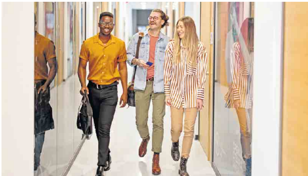
Die Jobs im Bankensektor sind facetten- und abwechslungsreich und für junge Leute attraktiv - oftmals ganz ohne den klassischen Dresscode mit Anzug und Krawatte.

Neben der klassischen Ausbildung zur Bankkauffrau oder zum Bankkaufmann bieten die Volksbanken und Raiffeisenbanken beispielsweise auch Ausbildungen in ganz anderen Bereichen an - etwa in IT-Berufen, im Dialogmarketing, zur Kauffrau oder zum Kaufmann für Bürokommunikation oder im E-Commerce. Hinzu kommen verschiedene Varianten und Fachrichtungen des dualen Studiums. „Es verbindet von Anfang an Praxiserfahrung mit theoretischem Wissen und einem Bachelorabschluss“, erklärt Dr. Stephan Weingarz, Leiter Personalmanagement beim Bundesverband der