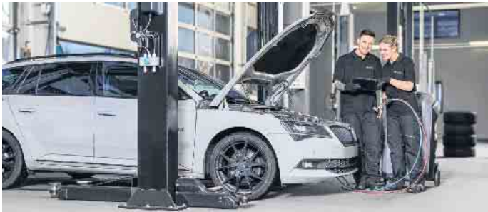
Auszubildende zum Kfz-Mechatroniker lernen die komplexe Technik und ihre Wartung von Grund auf kennen.