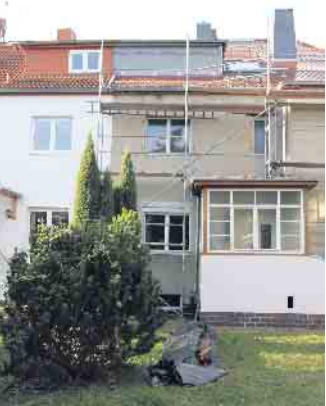
Grundlage für die Planung einer Altbausanierung ist eine gründliche Bestandsaufnahme des Hauses, am besten mit unabhängiger Beratung.

Lohnend ist die Modernisierungsberatung auch beim Erwerb einer gebrauchten Immobilie. Bevor der Kaufvertrag unterzeichnet ist, können bei einem Vorab-Check alle Baumängel, der energetische Zustand des Hauses sowie anstehende Modernisierungen aufgezeigt werden. So bekommt der Kaufinteressent mehr Klarheit darüber, mit welchen Zusatzkosten er neben dem Kaufpreis und den Kaufnebenkosten rechnen muss. (DJD)