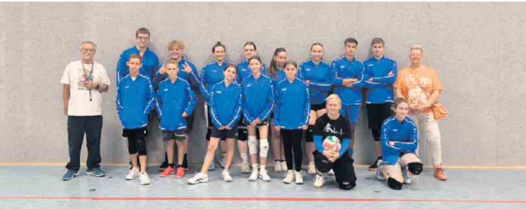
Spendenübergabe an die Volleyball-Mannschaft des BSC 03