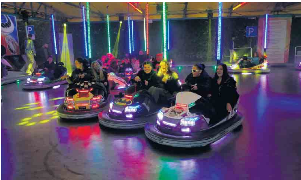
Auch der beliebte Autoscooter ist 2024 wieder dabei