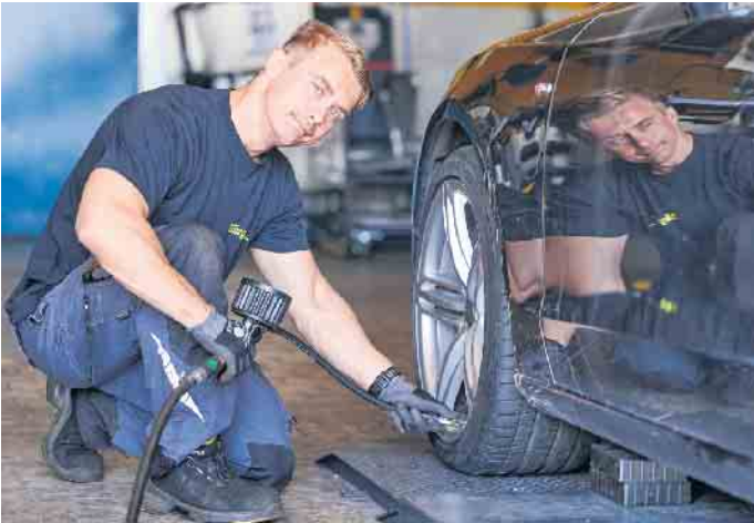
Automobile Technik beherrschen: Die Ausbildung in der Kfz-Werkstatt verspricht viel Abwechslung und sehr gute Zukunftsperspektiven.