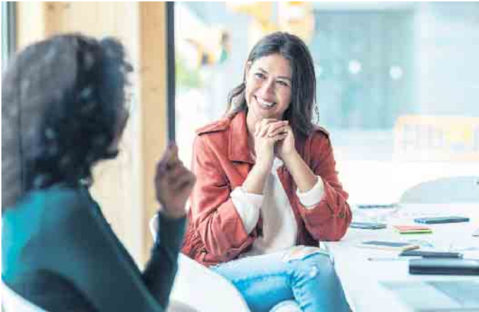
Ein Bewerbungsgespräch ist immer ein Dialog, bei dem auch der Arbeitgeber auf dem Prüfstand steht.