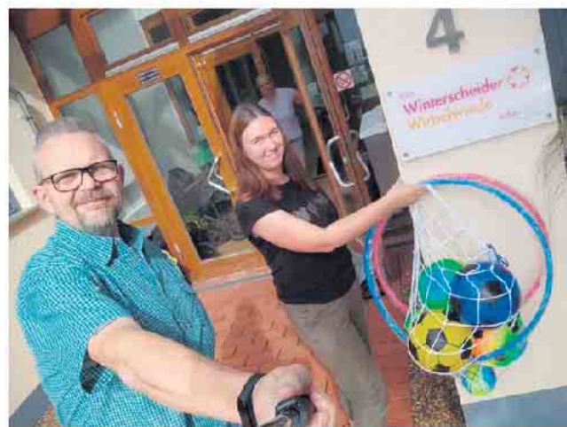
Übergabe des Spielzeugs

Der Weltkindertag (20. November) wurde im Jahre 1954 von den Vereinten Nationen eingeführt und hat das Ziel, auf die Situation von Kindern weltweit aufmerksam zu machen und ihre Rechte in den Fokus zu rücken.