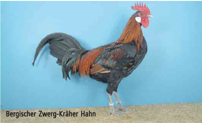
Bergischer Zwerg-Kräher Hahn

Zwerg-Schlotterkämme - in allen anerkannten Farbschlägen. Der Verein wünscht ein schönes Oktoberwochenende und freut sich über ihren Besuch auf der 44. Ortsschau.