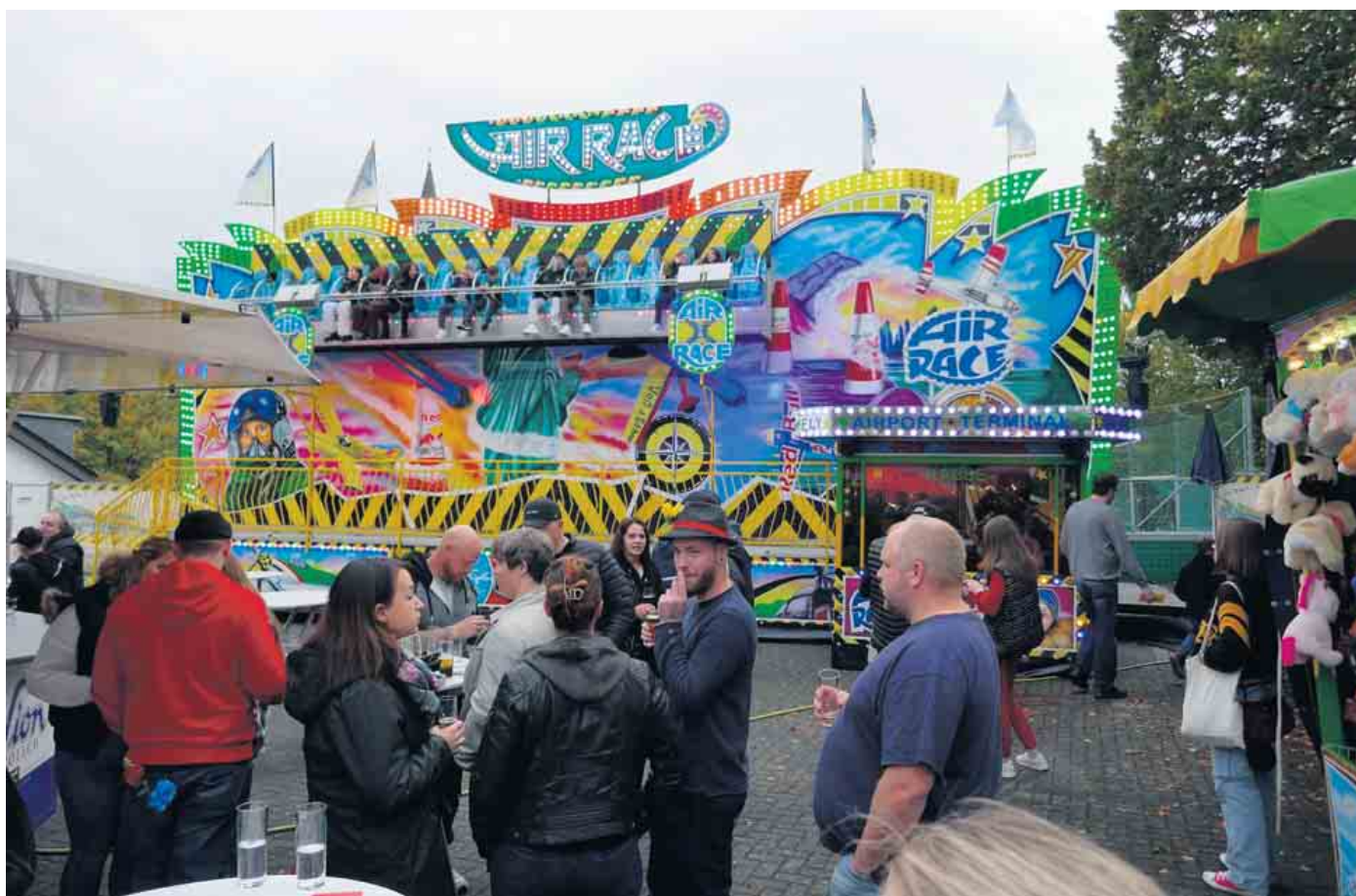
Treffpunkt Dörper Familienkirmes

Wir laden wieder ein zur beliebten Dörper Familienkirmes, wie immer am dritten Oktoberwochenende. Sie beginnt am Freitag, 13. Oktober nachmittags an der Sekundarschu-