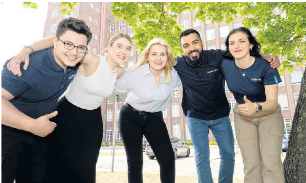
Junge Karrierestarter sollten ihr späteres Betätigungsfeld nach persönlichen Neigungen wählen.

Tipps eines Recruiters zur praktikablen Herangehensweise für den Karrierestart