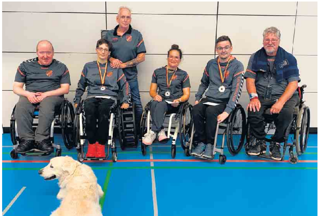
Teilnehmer des DP Köln mit Betreuer Achim Sommer.

Im Rollstuhlwettbewerb werden einige Spieler*innen für des TuS