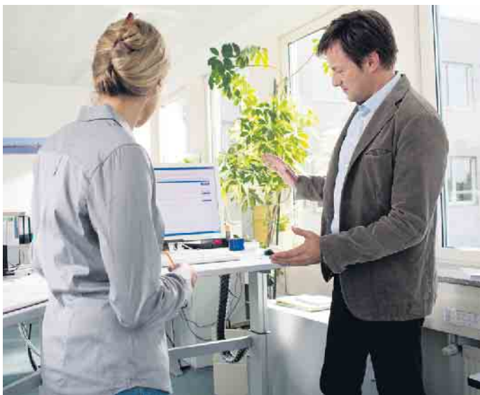
In Teams werden ergonomische Probleme am Arbeitsplatz besprochen.

men hat die Berufsgenossenschaft Energie Textil Elektro Medienerzeugnisse (BG ETEM) den ErgoChecker entwickelt, der dabei hilft, Handlungsbedarfe zu erkennen und Tätigkeiten ergonomisch zu gestalten. Eine kurze Anleitung gibt zum einen Tipps, wie Führungskräfte ihr Team dazu einladen können, ergonomische Probleme am Arbeitsplatz aufzudecken. Zum anderen enthält der ErgoChecker einen doppelseitigen Fragebogen für Mitarbeiterinnen und Mitarbeiter, mit dem sie belastende Tätigkeiten jeweils in Zweier-Teams beobachten, ausführen, besprechen sowie ihre Lösungsvorschläge dokumentieren können. Unter