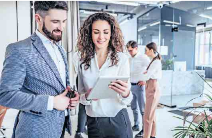
Bankkauffrau und Bankkaufmann zählen zu den wichtigsten Ausbildungsberufen in Deutschland.