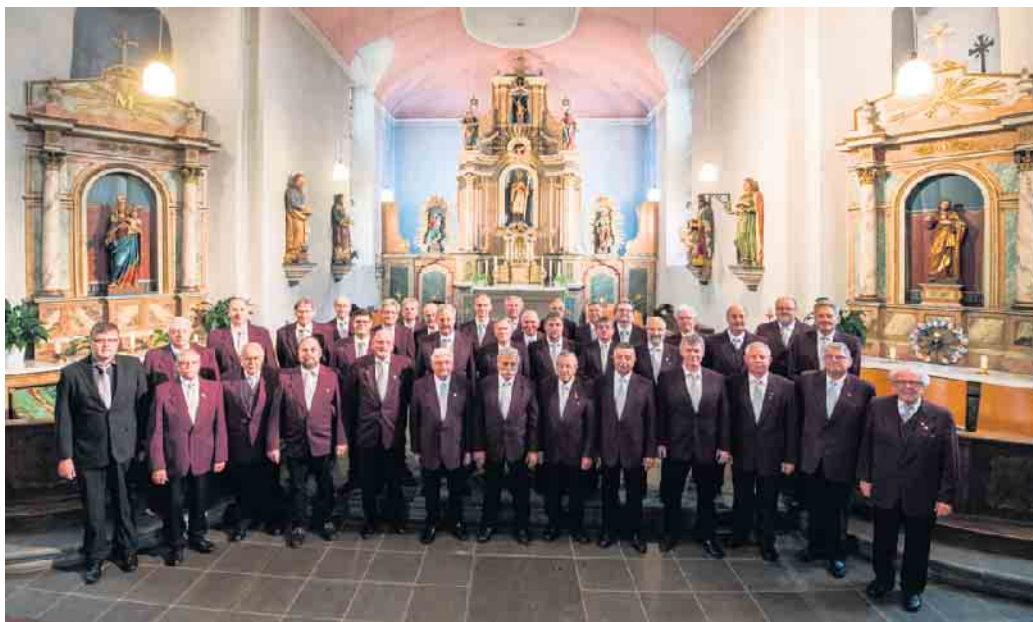
Wir der MGCV

deren Konzerte, Messen u.ä., die MGCV-Touren, Karnevalssitzungen, Kirmes uvm. werden nebst dem als sehr angenehm empfundenen Vereinsleben in guter Erinnerung bleiben.