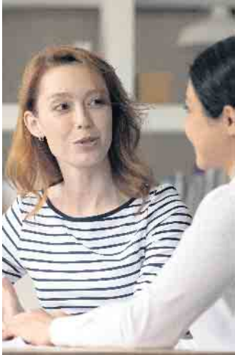
Im Erstgespräch verschafft sich die Beraterin einen Überblick über Situation, Ziele und Kompetenzen der Person.

Der Verlust des Arbeitsplatzes gehört für viele Menschen zu den schlimmsten Erfahrungen, die man im Leben machen kann. Zu den finanziellen Sorgen kommen häufig zunächst einmal Niedergeschlagenheit, Unsicherheit und vor allem Selbstzweifel. Irgendwann aber geht der Blick auch wieder nach vorne. Nun ist es wichtig, die Weichen für den beruflichen Neustart richtigzustellen - und dabei kann man sich von Profis individuell begleiten lassen. Unterstützung durch Arbeitsagentur und Jobcenter per Gutschein Arbeitssuchende haben unter bestimmten Voraussetzungen Anspruch auf einen sogenannten Aktivierungs- und Vermittlungsgutschein (AVGS) der Agentur für Arbeit oder des Jobcenters. Mit der Förderzusage kann man sich einen zugelassenen Träger suchen, der durch „Maßnahmen zur Aktivierung und beruflichen Wiedereingliederung“ beim Neustart tatkräftig hilft. Die Kosten dafür rechnet der Anbieter direkt mit der Agentur für Arbeit oder dem Jobcenter ab. Passende Angebote für Arbeitssuchende in ganz Deutschland findet man beispielsweise beim Institut für