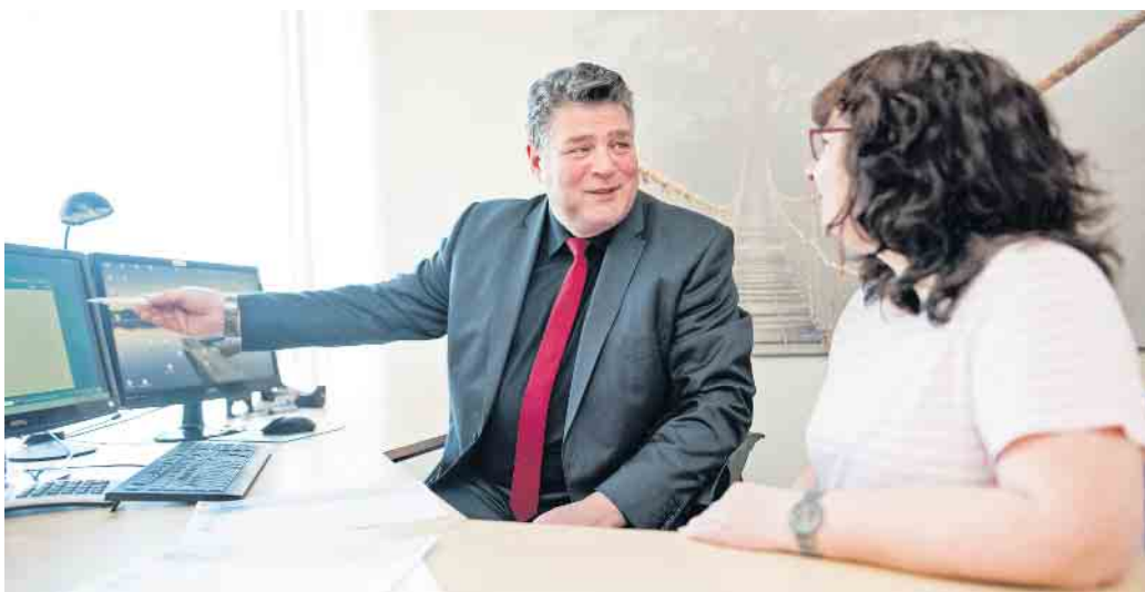
Der Berater erstellt gemeinsam mit der Arbeitssuchenden einen individuellen Förder- und Vermittlungsplan zur Wiedereingliederung ins Berufsleben.

Berufliche Bildung (IBB), mehr Informationen dazu gibt es unter www.ibb.com/avgs . „Wir setzen vor allem auf individuell zugeschnittene Coachings und fachliche Weiterbildungen, bei Bedarf und mit