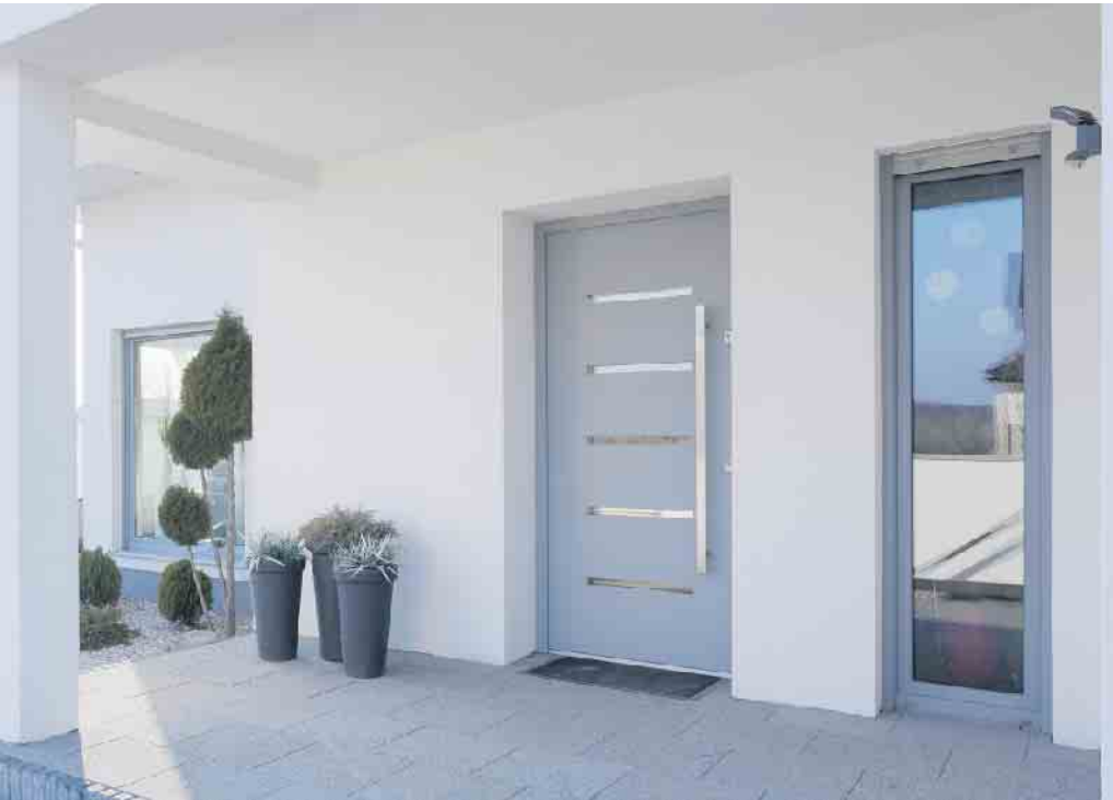
Minimalistisches und stilvolles Design: Setzen Sie auf schlichte Eleganz und moderne Akzente für Ihre neue Haustür.

Eine neue, moderne Haustür vereint zahlreiche Vorzüge, die neben optischen Hinguckern idealerweise auch funktionale Verbesserungen mit sich bringen. Neben einem angesagten Design stehen auch Einbruchssicherheit, Energieeffizienz und Nachhaltigkeit im Fokus der aktuellen Haustüren-Trends. Bei der