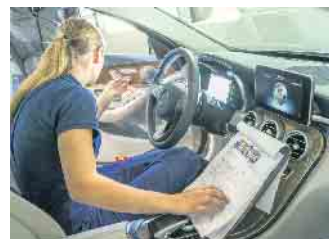
Ausbildungsberufe in der Kraftfahrzeugbranche bieten jungen Menschen gute Entwicklungschancen und zukunftssichere Arbeitsplätze.

Ein typischer Einstieg in technische und kaufmännische Automobilberufe führt über den klassischen dualen Bildungsweg mit betrieblicher Ausbildung und Berufsschule. Unter www.wasmitautos.de gibt es eine Vielzahl von Informationen zu den Berufsbildern und ihren Anforderungen sowie einen Betriebsfinder zur Suche nach Ausbildungsplätzen. Auch die Karrierechancen durch Spezialisierungen und Höherqualifizierung werden beleuchtet. Zweijährige Weiterbildungen eröffnen zum Beispiel Wege zum geprüften Kfz-Servicetechniker, Automobil-Verkäufer oder -Serviceberater. Über den klassischen Kfz-Meister sind Aufstiege zum Werkstattmanager oder Betriebsleiter möglich, und natürlich erlaubt der Meisterbrief die Übernahme oder Grün-