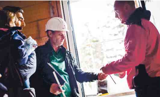
Beim Erwerb einer Eigentumswohnung im Neubau lassen sich Baumängel durch eine baubegleitende Qualitätskontrolle oftmals vermeiden.

Wer den Aufwand für den Bau eines Eigenheims scheut, erhofft sich oftmals vom Kauf einer Eigentumswohnung den einfacheren Weg zum Immobilienbesitz. Aussuchen, kaufen, einziehen – ganz so unkompliziert ist der Erwerb dann aber doch nicht. Auch ein Wohnungskauf stelle schließlich ein wirtschaftliches Risiko dar, erklärt Erik Stange, Pressesprecher des Bauherren-Schutzbund e.V. (BSB). Wenn die Entscheidung für ein Objekt gefallen ist, stehen der Abschluss des Kaufvertrags und seine Beurkundung durch einen Notar an. Der Entwurf des Vertragsdokuments muss zwei Wochen vor Vertragsabschluss vorliegen. So bleibt dem Kaufinteressenten genügend Zeit für eine Vertragsprüfung, idealerweise durch einen unabhängigen Vertrauensanwalt. „Wichtig ist dafür ein aktueller