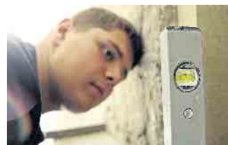
Bei der Ausbildung zum Ofen- und Luftheizungsbauer lernt man vielfältige Tätigkeiten kennen.

cen. Einen #ofenhelden Infotalk findet man kostenfrei unter https://wir-sind.ofenhelden.info . Ofenbauer informieren hier über ihren abwechslungsreichen Beruf. Wer ihn kennenlernen möchte, sollte sich nach einem ein- oder mehrwöchigen Praktikum bei einem Ofenbauerbetrieb in der Nähe erkundigen, unter www.ofenhelden.info gibt es dazu mehr Informationen. (DJD)