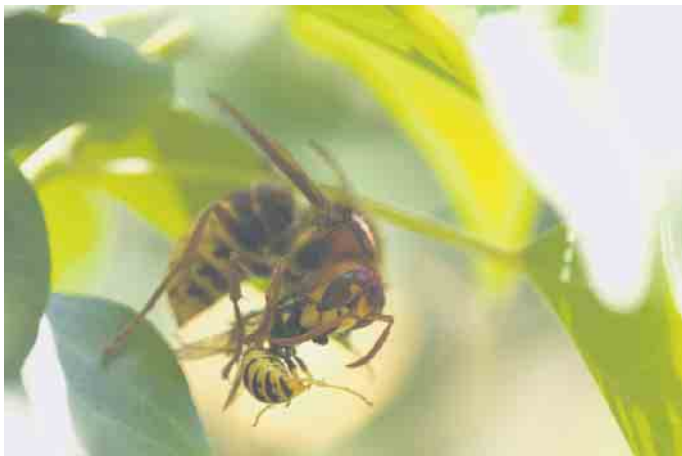
eine Hornisse beim Verspeisen einer Wespe.

Vielmehr nehmen Hornissen einen sehr wichtigen Platz im Ökosystem ein, da sie zur Aufzucht ihrer Brut tierische Kost in Form von Insekten benötigen. Hierzu zählen unter anderem auch etliche sogenannte „Schädlinge“, von denen ein intaktes Hornissenvolk im Hochsommer bis zu 500 Gramm täglich verspeist. Auf dem Speiseplan der fleißigen Jäger stehen beispielsweise Fliegen, Raupen jeglicher Art bis hin sogar zu Wespen. Der Pflaumenkuchen oder das Grillsteak werden dagegen - anders als von Wespen gewohnt - nicht angefliegen. In unserer Region scheinen die Bestände der Hornissen noch weitestgehend stabil zu sein. Deutschlandweit zählen Hornissen allerdings nach wie vor aufgrund ihrer akuten Bestandsgefährdung zu den besonders geschützten Arten. Daher ist es auch verboten die Tiere mutwillig zu beunruhigen, zu töten oder ihre Nester zu entfernen. Lediglich in Ausnahmefällen erteilt die Untere Naturschutzbehörde des Rhein-Sieg-Kreises eine Genehmigung zur Umsiedlung eines Nestes. Hierfür muss der Standort des Nestes allerdings besonders kritisch sein. Was kann man tun, um den Brummern einen artgerechten Unterschlupf im heimischen Garten zu bieten? Am liebsten legen Hornissen von Natur aus ihre Brutstätten in Baumhöhlen an. Wenn sie diese in aufgeräumten