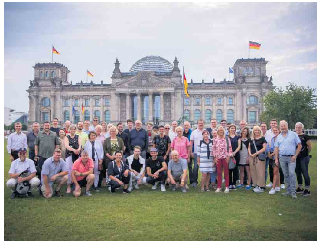
Die Teilnehmer der Bildungsreise nach Berlin