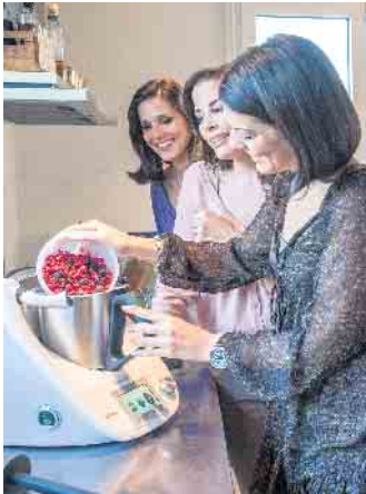
So wird kaufen zum Erlebnis: Bei Produktpräsentationen zu Hause kann man in Ruhe alles ausprobieren.