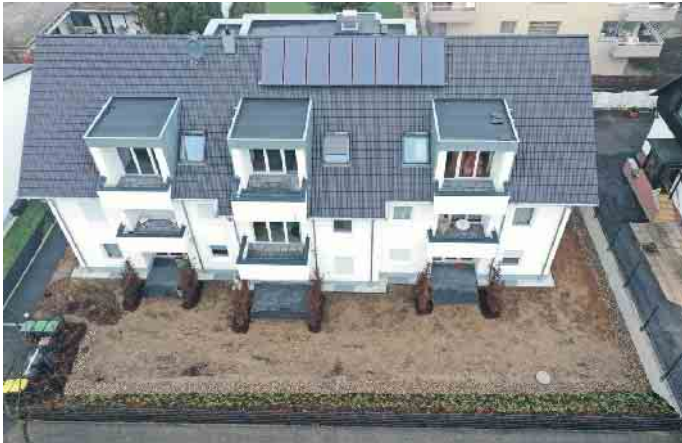
Das Dachdeckerhandwerk, der richtige Ansprechpartner für die Solaranlage auf dem Dach.

Im Bereich Gebäudesektor liegt Deutschland im Vergleich mit den zwanzig wichtigsten Industrie- und Schwellenländern bei der Energieeffizienz im Neubau vorne. Die weniger gute Nachricht ist die schleppende energetische Sanierung bei älteren Gebäuden.