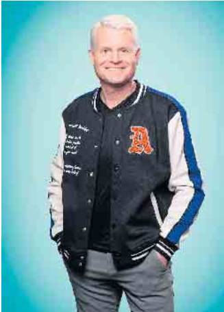
Entertainer und Moderator Guido Cantz ist Teil einer Drohnen-Vorführung.