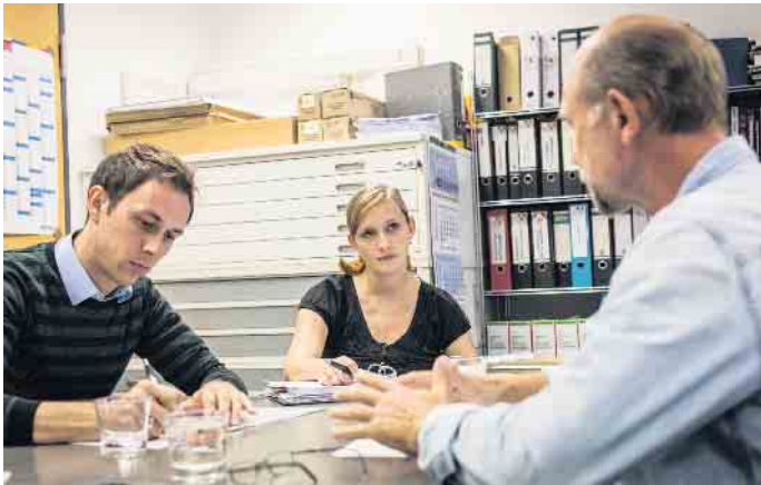
Viele Bauherren wissen nicht, welche gesetzlichen Vorgaben es für die Gestaltung von Bauverträgen gibt. Eine unabhängige Kontrolle der Unterlagen gibt daher mehr Sicherheit.

Da Bauherren in der Regel weder hohen Bausachverstand mitbringen noch Experten im Bauverbraucherrecht sind, empfiehlt Stange,