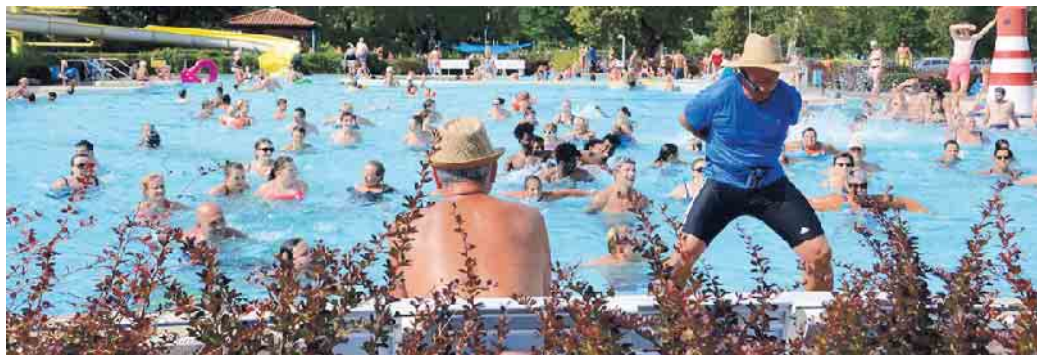
Die Bandbreite der Tätigkeitsfelder in Bäderbetrieben ist groß. Von Schwimmbadtechnik bis zum Betrieb am Becken muss alles im Blick behalten werden.

sind vielfältig. Sie können in öffentlichen Schwimmbädern, Spa- und Wellnesszentren, Freizeitparks oder Fitnessstudios arbeiten. Es besteht auch die Möglichkeit, sich auf bestimmte Bereiche wie die Wasserpflege, die Schwimmkursleitung oder die