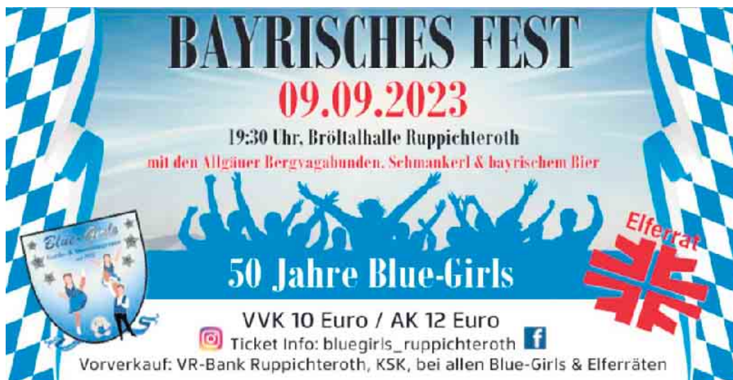
Flyer des Bayrischen Festes am 9. September

50 Jahre Blue-Girls beim TV Ruppichteroth