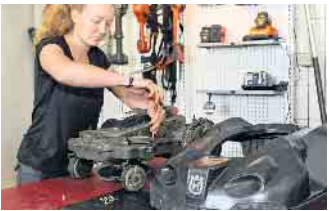
Bei mechatronischen Berufen ste-hen Wartung und Reparatur von Garten- und Outdoorgeräten im Mittelpunkt.

Berufe: Ausbildung im Motorgeräte-Fachhandel bietet ausgezeichnete Perspektiven