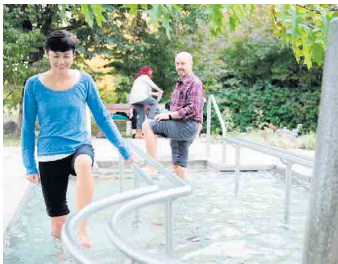
Wassertreten macht fit!

Wassertreten richtig und gut! Bitte immer ein Handtuch und warme Socken mitbringen; zur Bürstenmassage eine eigene Bürste. Treffpunkt bei jedem Wet-