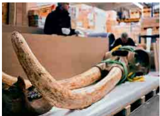
Das Amerikanische Mastodon war eine Art der Rüsseltiere aus der ausgestorbenen Gattung Mammut. Der Transport der kostbaren Zähne stellt auch für spezialisierte Kunstlogistiker eine Herausforderung dar.

jede Mitarbeitende permanent das Jobprofil verändern und nach einer internen Schulung quasi horizontal wechseln, Abwechslung ist hier das Salz in der Suppe.“ (DJD)