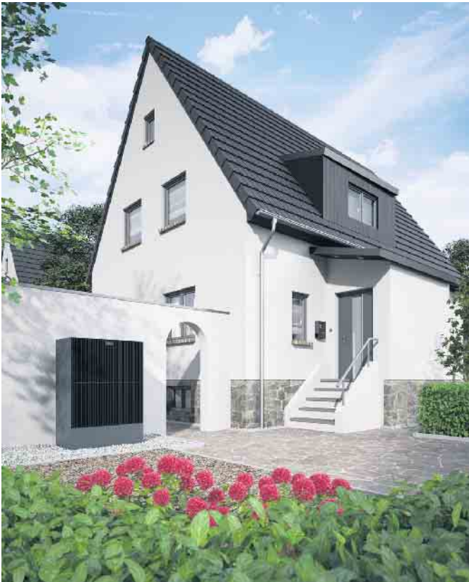
Viessmann Wärmepumpe Vitocal 25 x -A.

Möglichkeit, die neueste Wärmepumpengeneration von Viessmann im Echtbetrieb zu erleben. Wir freuen uns auf zahlreiche Besucher.