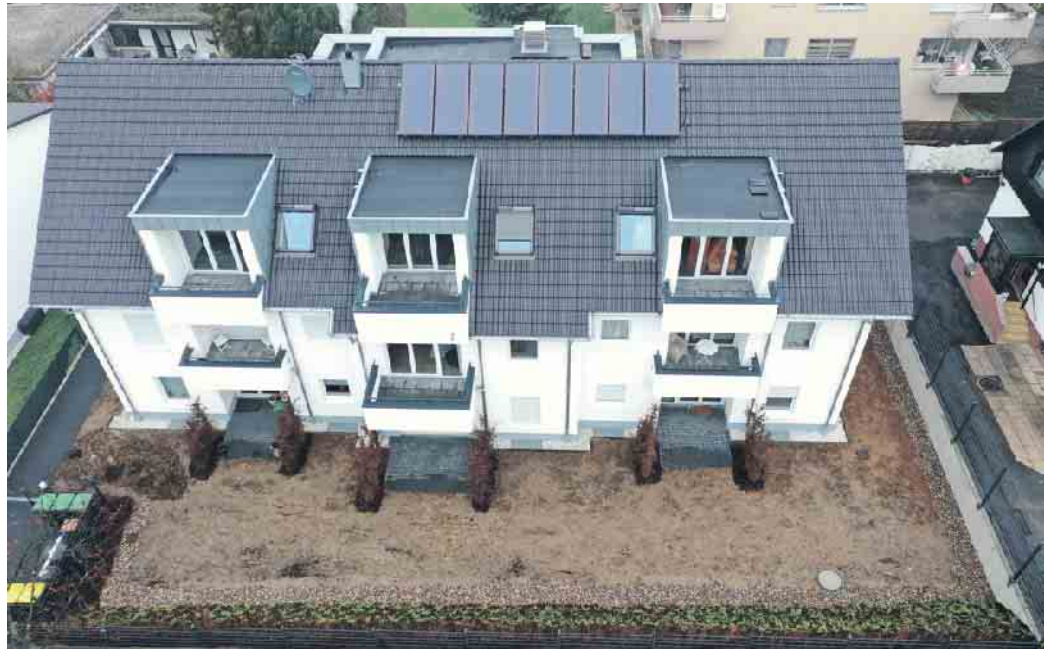
Das Dachdeckerhandwerk, der richtige Ansprechpartner für die Solaranlage auf dem Dach.

Einer der Gründe sind unzureichende Renovierungsraten. Angestrebt werden müsse mindestens eine Verdoppelung der derzeitigen Rate, die aktuell bei 1 % liegt. Besser noch wäre nach Meinung der Klimaexperten eine Rate von 3,5 %. Hier kommt das Dachdeckerhandwerk ins Spiel: Sie führen geeignete Maßnahmen wie Wärmedämmung an Wänden, am Dach oder an der oberen Geschossdecke aus, durch die schon viel Energie eingespart werden kann. Dachdecker und Dachdeckerinnen sind wichtige Berater, wenn es darum geht, welche Maßnahmen sinnvoll sind, aber auch, welche Fördergelder infrage kommen. Zum Beispiel lassen sich durch Kredite bei der KfW oder der Nutzung von Steuerermäßigungen für energetische Sanierungen auch im privaten Wohnungsbau deutliche Einspareffekte erzielen. „Dachdecker sind daher ganz wichtige Akteure, wenn es um das Erreichen der Klimaschutzziele geht, denn sie sind Spezialisten, die die notwendigen Sanierungs-Maßnahmen im Gebäudebestand planen und durchführen“, erläutert Claudia