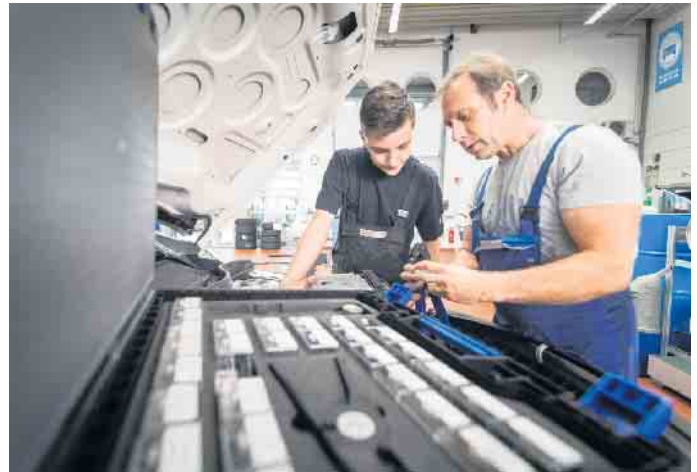
Eine Ausbildung im Kfz-Gewerbe eröffnet vielfältige Berufsbilder und Karriereoptionen.

Dazu werden die Perspektiven aufgezeigt, die sich für die Berufseinsteiger nach dem erfolgreichen Ausbildungsabschluss eröffnen. So bringt bereits eine zweijährige Weiterbildung Spezialisierungen innerhalb des gewählten Ausbildungsberufs hervor, etwa den geprüften Kfz-Service-Techniker, geprüften Automobil-Verkäufer oder -Serviceberater sowie weitere Kfz-spezifische Qualifizierungen. Darüber hinaus steht auch der Weg zu Führungspositionen oder zur Selbstständigkeit offen. Der klassische Meister etwa kann zum Werkstattmanager oder Be-