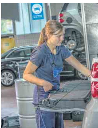
Berufe in der Kfz-Branche leisten einen wichtigen Beitrag zur Mobilität der Gesellschaft.

Master of Business Administration in technischen und kaufmännischen Studiengängen liegen in Reichweite. (djd)