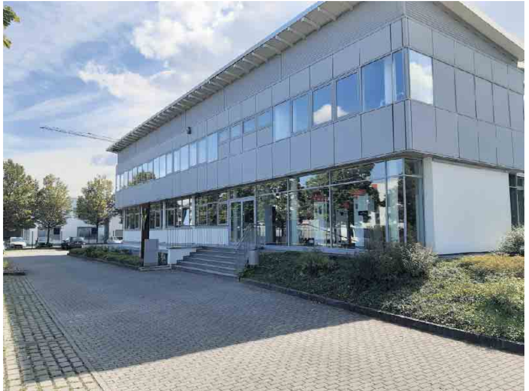
Viessmann Verkaufsniederlassung Troisdorf in der Josef-Kitz-Straße 16.

Seit einigen Monaten beherrschen die Themen steigende Energiepreise sowie die Notwendigkeit zur Umstellung der Heizung auf regenerative Technologien die Medien. Die Verunsicherung ist in Fachkreisen und insbesondere bei Endkunden groß. Vor diesem Hintergrund hat sich die Viessmann Niederlassung Köln-Bonn dazu entschieden, vom Mittwoch, 17.08.2022, bis zum Freitag, 19.08.2022 , erstmalig Endkundentage durchzuführen. In der Zeit von 10:00 bis 18:00 Uhr haben interessierte Endkunden - gerne in Begleitung von unseren Fachpartnern - die Möglichkeit, die neuesten Wärmepumpentechnologien, Photovoltaiksysteme und Stromspeicher aus dem Hause Viessmann kennenzulernen. An diesen Tagen werden Experten der Niederlassung Köln-Bonn den Fragen der Besucher Rede und Antwort stehen. Für eine kompakte Information wird auch ein mit den vorgenannten Technologien bestückter Info-Truck vor Ort sein. Ferner haben Sie die