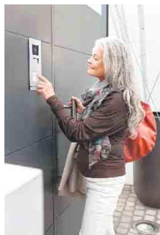
Viele Smart-Home-Funktionen können das Leben deutlich erleichtern und sicherer machen.

fachbetrieb schafft gute Voraussetzungen, um eine Vielzahl von Komfort- und Sicherheitsfunktionen schnell einbauen und problemlos nachrüsten zu können. Durch Elektroinstallationsleerrohre lassen sich Elektro- und Kommunikationsleitungen jederzeit nachträglich einziehen. Eine hohe Anzahl von Steckdosen - auch in der Küche, im Bad oder an Treppen - erleichtert den Einbau von Assistenzsystemen wie Treppen- oder Wannenliften und anderen Vorrichtungen zur Höhenverstellung. Schalterdosen mit größeren Montagetiefen erlauben eine einfache Umrüstung von Schaltern auf automatisch schaltende Präsenz- oder Bewegungsmelder. (djd)