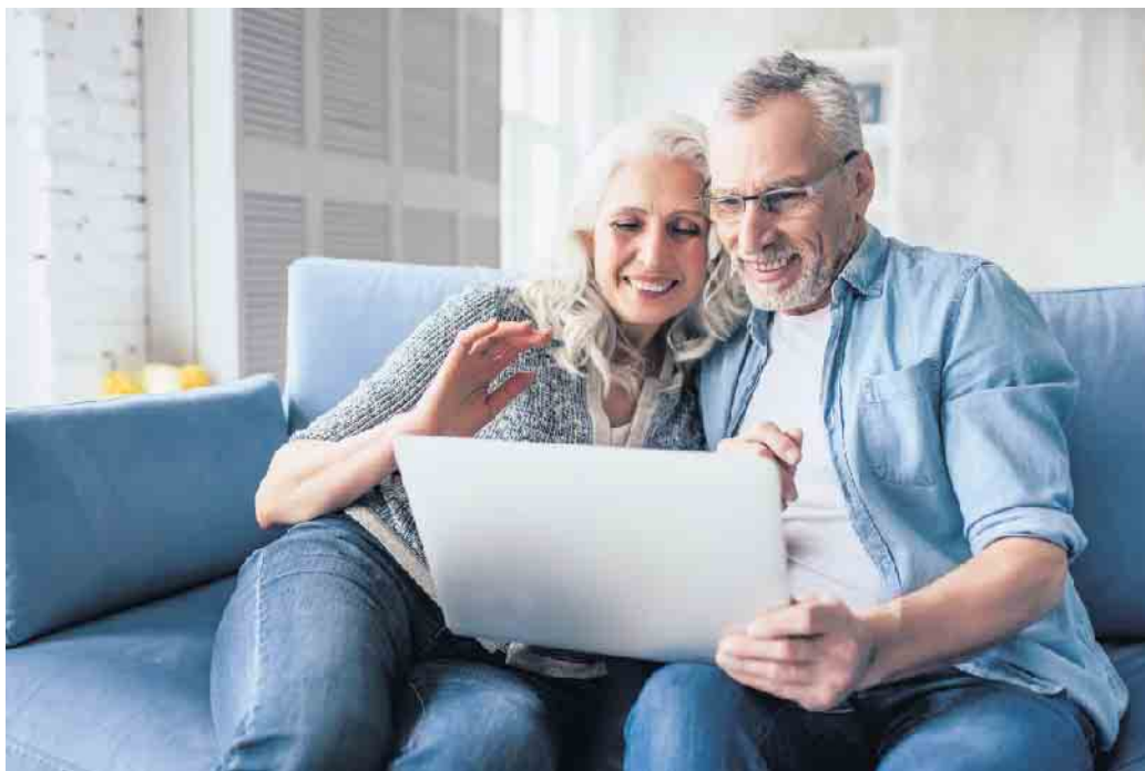
Bei der Planung einer Hausmodernisierung sollte man nicht vergessen, Komfort und Sicherheit für jede Lebenslage mit einzuplanen.

Eine automatisierte Beleuchtung, Türkommunikationssysteme und smart vernetzte Elektrogeräte erleichtern viele alltägliche Abläufe und geben Sicherheit. Diese und eine Vielzahl anderer unterstützender Systeme und Maßnahmen werden unter dem Begriff Active Assisted Living, kurz AAL, zusammengefasst. Als Beispiele für Anwendungen, die ein gut verknüpftes Smarthome-System ermöglicht, nennt Simon automatisierte Rollläden, welche die kräftezehrende Gurtbedienung überflüssig machen, das automatische Öffnen von Türen, die intelligente Beleuchtungssteuerung durch Bewegungsmelder oder Schalter und Steckdosen mit Orientierungslichtern. Zudem lassen sich Befehle zu Szenarien zusammenfassen - etwa ein einziger Schaltbefehl, um beim Verlassen des Gebäudes alle