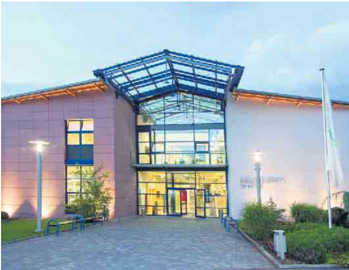
Das Bundesausbildungszentrum der Bestatter.