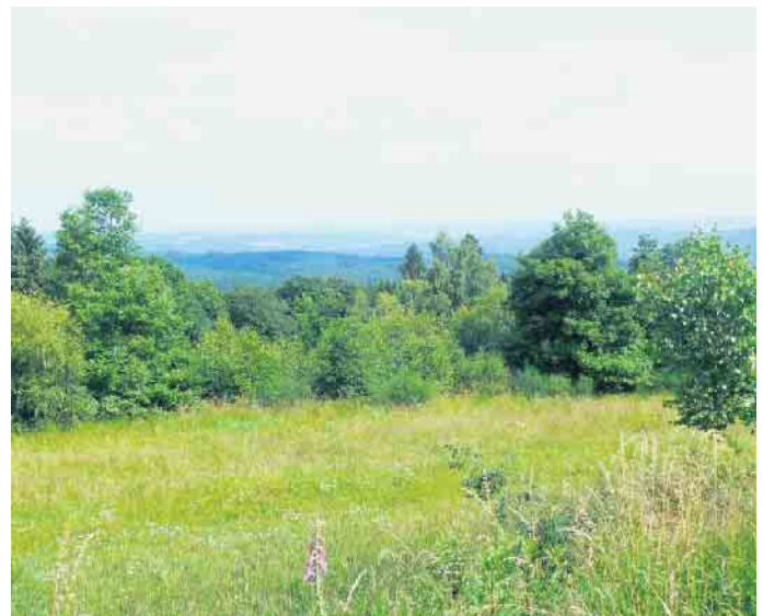
Blick vom Hohen Wäldchen in den Westerwald

tung Westen bis zu den Braun- kohlekraftwerken westlich Köln. Aus ökologischer Sicht bieten diese Kahlschläge große Chan- cen. Aufgrund der veränderten Lichtverhältnisse wird der Arten- reichtum in den ersten Jahren regelrecht explodieren. Hier wer- den schon in wenigen Jahren ar- tenreiche Mischwälder - Zu- kunftswälder - entstehen. Das größte zusammenhängende Waldgebiet des Bergischen Lan- des wird aus ökologischer und naturschutzfachlicher Sicht er- heblich an Wert gewinnen. Ziel der Wanderung ist das Natur- schutzgebiet „Hohes Wäldchen“ mit seinen artenreichen Mager- rasen und Heideflächen. Anmeldung unter 02295-6572