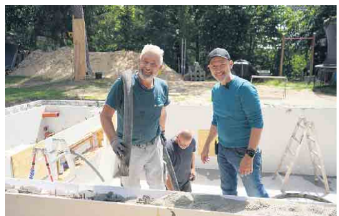
Gute Laune beim Poolbau.