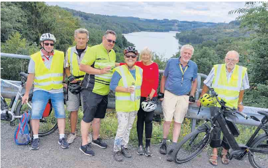
Die letzte E-Bike-Runde führte uns zur Wiehltalsperre