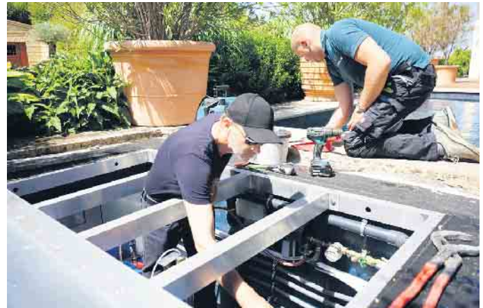
Arbeiten am Technischacht.

Gibt es einen Beruf, in dem man Träume erfüllen kann? In dem individuelle Beratung genauso gefragt ist wie handwerkliches Können und ein Gespür für Ästhetik und Design? In dem man Werte schafft, die für andere den „Himmel auf Erden“ bedeuten? Schwimmbadbauer ist so ein Beruf - vor allem, wenn es um den Bau privater Pools geht. Hier sind kreative Könnern am Werk, die die Wellnesswünsche ihrer Kunden wahr werden lassen. Schwimmbadbauer schaffen Entspannungsoasen, Urlaubsorte ohne Anreise oder schlicht Wasserspaß vor der Haustür. Wer das beherrscht, ist ein Allroundtalent. Schließlich müssen Poolexperten umfassendes Fachwissen haben. Beckenbau und Bauphysik sind ebenso gefragt wie Wärmegewinnung und Wasseraufbereitung.