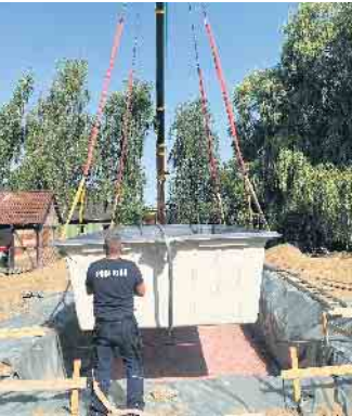
Ein Becken findet seinen Platz.

des Bundesverbandes Schwimmbad & Wellness e.V. (bsw) unter www.bsw-web.de . (akz-o)