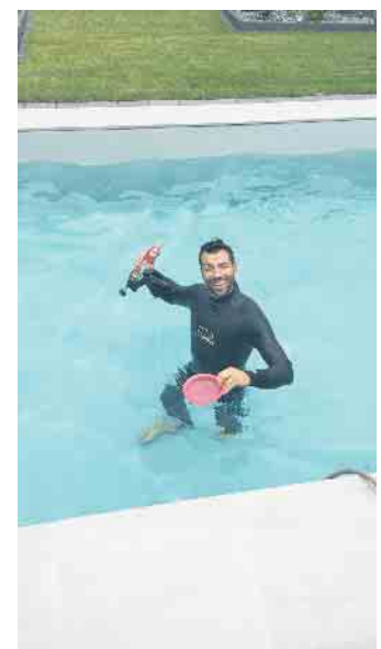
Wasserspaß bei der Arbeit.

Gibt es einen Beruf, in dem man Träume erfüllen kann? In dem individuelle Beratung genauso gefragt ist wie handwerkliches Können und ein Gespür für Ästhetik und Design? In dem man Werte schafft, die für andere den „Himmel auf Erden“ bedeuten? Schwimmbadbauer ist so ein Beruf - vor allem, wenn es um den Bau privater Pools geht. Hier sind kreative Könnern am Werk, die die Wellnesswünsche ihrer Kunden wahr werden lassen. Schwimmbadbauer schaffen Entspannungsoasen, Urlaubsorte ohne Anreise oder schlicht Wasserspaß vor der Haustür. Wer das beherrscht, ist ein Allroundtalent. Schließlich müssen Poolexperten umfassendes Fachwissen haben. Beckenbau und Bauphysik sind ebenso gefragt wie Wärmegewinnung und Wasseraufbereitung.