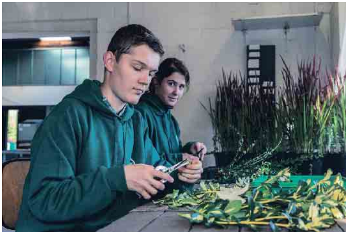
Abwechslungsreich und wichtig für die Zukunft: Ausbildung zum Baumschulgärtner.

gedüngt, geschnitten oder geerntet werden - die Fragen der Kunden sind vielfältig. Tiefes Fachwissen, Kompetenz und selbstverständlich Freundlichkeit und der Spaß am Job sind dabei wichtig. Doch nicht nur vor Ort in den Baumschulen, sondern auch wenn es um die Gestaltung von Parks oder Grünanlagen geht, sind Baumschulgärtner die richtigen Ansprechpartner.