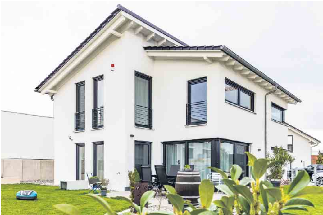
Alarmanlagen schützen nachweislich vor Einbrüchen. Dennoch sind Sicherheitssysteme in Deutschland noch weit weniger verbreitet als in anderen Ländern Europas oder den USA.

Für einen optimalen Schutz der eigenen vier Wände ist ein Sicherheitscheck empfehlenswert. Dabei inspiziert ein Sicherheitsexperte das Objekt, untersucht es auf typische Schwachstellen, ermittelt den persönlichen Sicherheitsbedarf der Bewohner und entwickelt auf dieser Basis ein individuelles