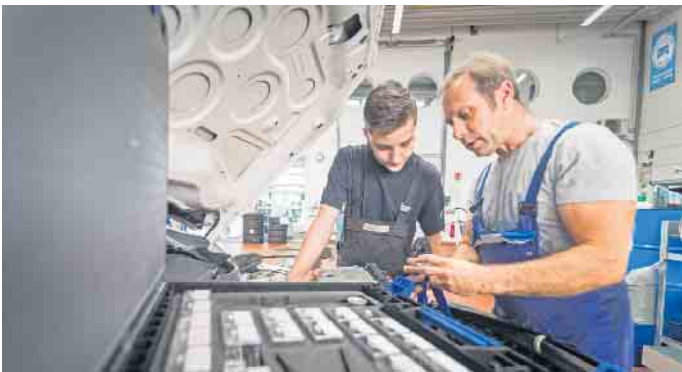
Die Lehre als Kfz-Mechatroniker gehört zu den beliebtesten handwerklichen Ausbildungen.

oder einen betriebswirtschaftlichen Abschluss an der Bundesfachschule im Kfz-Gewerbe (BFC) anstreben. Durch die Einordnung der Abschlüsse in den einheitlichen Deutschen Qualifikationsrahmen (DQR) ist zudem die Gleichwertigkeit zu akademischen Qualifikationen gegeben und die Wertigkeit der Aus- und Weiterbildungen europaweit angeglichen. (DJD)