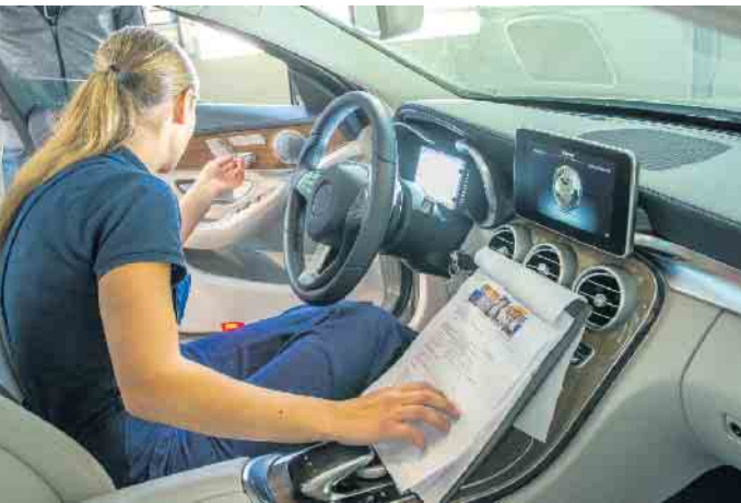
Berufe im Kfz-Gewerbe sind längst keine Männerdomäne mehr - die Ausbildungszahlen weiblicher Azubis steigen an.

Beim Hineinschnuppern in die Betriebspraxis können Einsteiger erste wichtige Eindrücke sammeln, welche Ausbildungsinhalte vermittelt werden und wie der Berufsalltag aussieht. Auch über Weiterbildungsmöglichkeiten und Perspektiven nach der Ausbildung erfährt man im Praktikum mehr. So kann man sich zum Beispiel auf Kfz-Servicetechnik oder als Automobil-Serviceberater spezialisieren