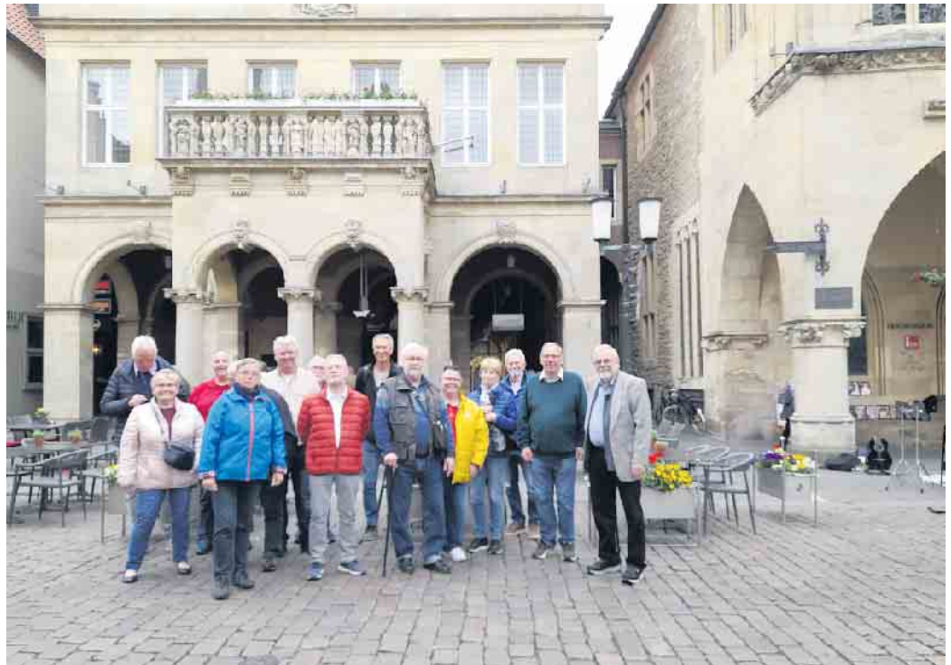
BB-Team auf dem Prinzipalmarkt