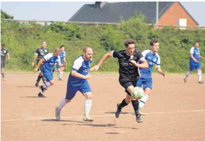
Spielszene 2 SVH vs Marienfeld II

Wir bedanken uns bei allen Unterstützern unserer diesjährigen Verlosung.