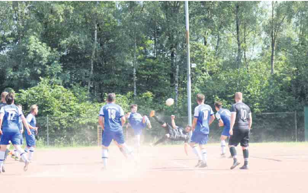
Spielszene 3 SVH vs Marienfeld II