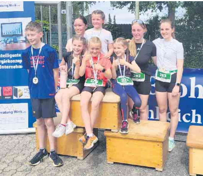
Die Jugendstarter des TuS Winterscheid

ten Zuschauern und seiner Familie empfangen. Aber was ist denn der PI-Lauf in Neunkirchen überhaupt? Wenn man die Marathonlänge durch eine mathematische Konstante, nämlich die Kreiszahl Pi - dividiert, hat man die wunderbare Streckenlänge von exakt 13,431 Kilometern. Die ist nämlich die längste Verbindung im Kreis des Marathons, was schlaue Mathematiker natürlich wissen. Wenn man die zu bewältigenden Höhenmeter berücksichtigt, nämlich 314 Höhenmeter ( \pi = 3,14 ) die es zu bewältigen gilt, steht die gelaufene Zeit völlig im luftleeren Raum. Alle unsere Sportler waren nach dem Lauf mit ihren individuellen Leistungen zufrieden. (AK = Altersklassenwertung)