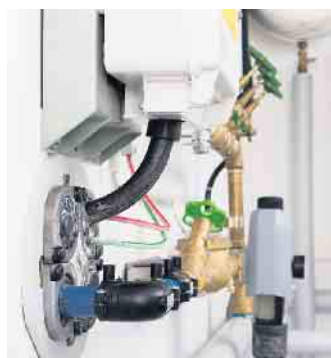
„Haustechnik ist nirgends besser aufgehoben als im Keller.“

kommen Bauherren günstiger weg als bei einer Vollunterkellerung, sondern auch schon beim Tiefbau: Weniger Erde muss ausgehoben, weniger Erdaushub bewegt und entsorgt werden. Meist reichen für einen Teilkeller eine Baugrube von 6,50 mal 6,50 Metern. „In der Praxis haben sich Teilkeller vor allem dann bewährt, wenn ihre Grundfläche etwa ein Drittel der Grundfläche des Hauses ausmacht“, erklärt Kellerexperte Wetzels. Etwa zwei Drittel des Hauses stünden dann auf einer Bodenplatte. Ein passgenaues Zusammenspiel aus Haus, Keller und Bodenplatte sei bei den qualitätsgeprüften Keller- und Bodenplattenherstellern mit dem RAL-Gütezeichen „Fertiggeller“ sichergestellt, so Wetzels. Ein weiterer Vorteil: Teilkeller sind mehr oder weniger flexibel unter dem Haus platzierbar. Eine praxistaugliche Anbindung ans Versorgungsnetz des Hauses sowie eine hinreichende Be- und Entlüftung sind allerdings zu beachten. Praktischerweise schließt zudem die Kellertreppe an die Erdgeschosstreppe an. „Die Kellerexperten arbeiten im Zuge der individuellen Planung verschiedene Möglichkeiten aus“, sagt der GÜF-Vorsitzende und schließt: „Die Haustechnik ist nirgends besser aufgehoben als unter dem Erdgeschoss. Wer sich also gegen eine Vollunterkellerung entscheidet, sollte wenigstens einen kleinen Keller einplanen statt gar keinen Keller.“ GÜF/FT