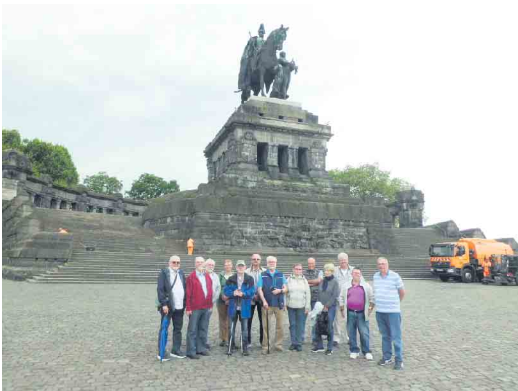
Das Bürgerbus-Team am „Deutschen Eck“