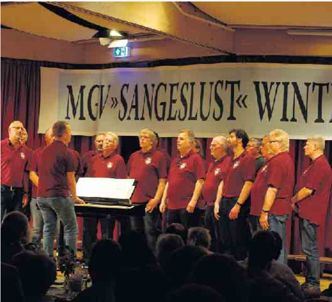
Der MGV Merten bei seinem Vortrag

Daran anschließend eroberten die „Gelben Säcke“ die Bühne und zeigten dem erstaunten Publikum, was alles als Musikinstrumente umfunktioniert werden kann. Das Repertoire der gelben Säcke kann sich wahrlich sehen lassen: Das Grundgerüst stellen zwar immer noch die Müll-