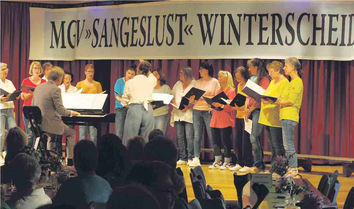
Der Frauenchor La bella musica aus Hennef