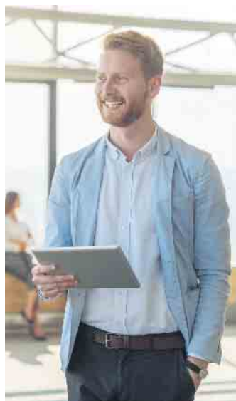
Die fortschreitende Digitalisierung verändert die Anforderungen an die Beschäftigten im Bankwesen rasant.

antwortung. „Dass alle wichtigen Entscheidungen in der Bank vor Ort getroffen werden, ist gerade für angehende Führungskräfte ideal“, erläutert der Experte. (djd)