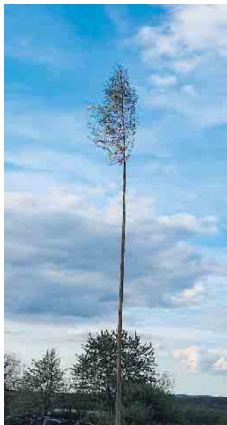
Gelebte Tradition: der Maibaum