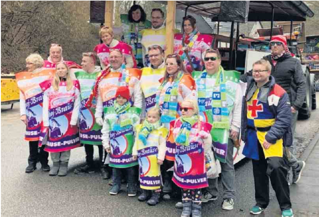
HKV in Hänscheid

35 Jahre prickelnd gut. Unter diesem Thema haben wir die Session in den Karnevalsumzügen ausklingen lassen. Danke allen die uns zugejubelt haben.