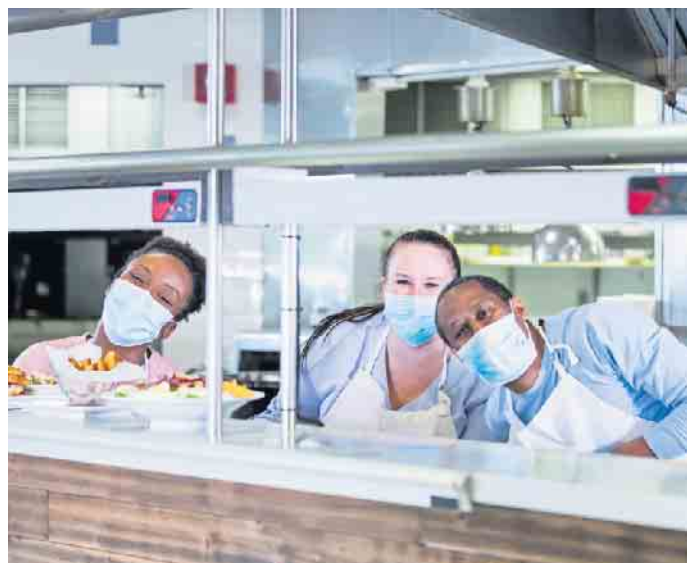
In der Systemgastronomie in Deutschland arbeiten Menschen aus rund 120 Nationen.

Hauptstraße 66 kanzlei@ra-michael-braatz.de 53819 Neunkirchen www.ra-michael-braatz.de Tel. 02247/5400 + 5485