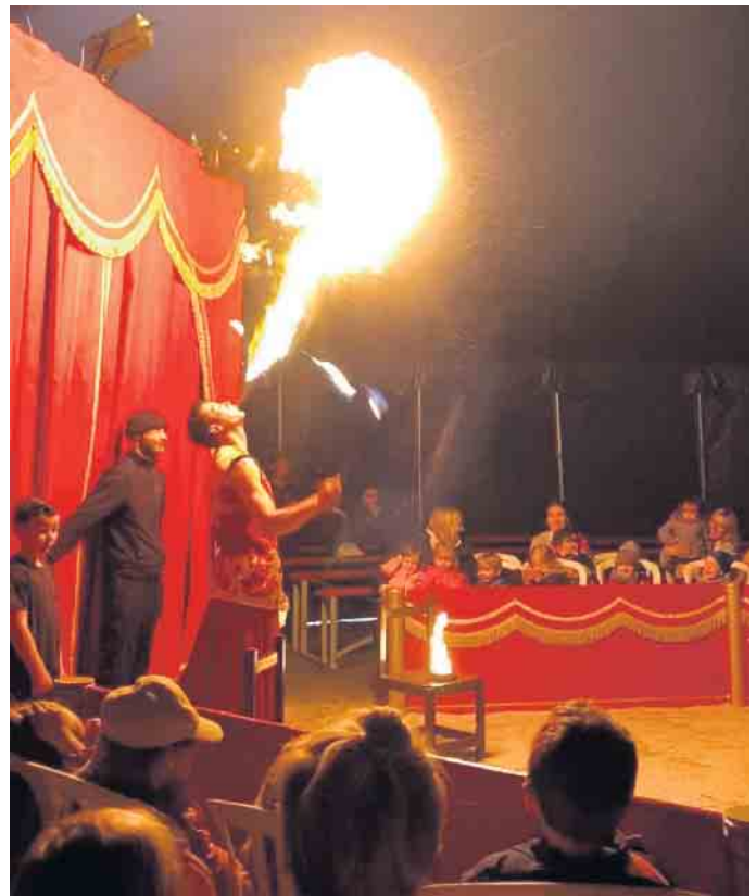
Feuer in der Manege