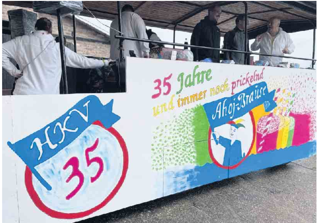
35 Jahre und immer noch prickelnd

Deshalb werden wir dieses Pfingstwochenende am Sonntag ab 14 Uhr losziehen und Holenfeld, Derenbach und Schmitzdörfggen besuchen bevor wir dann zum Eierkuchen backen wieder in Holenfeld den verdienten Abschluss feiern. Wir freuen uns über jede Art der Zuwendung. Seien es Eier, flüssige Lebensmittel oder zur Not auch Knisternds oder klimpernde Währung.