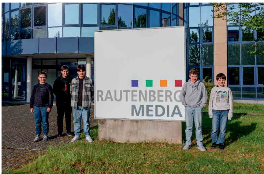
Boys' Day bei Rautenberg Media