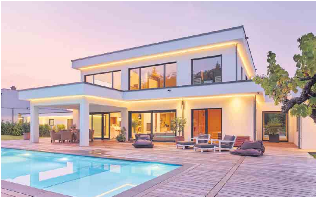
„Die Bauhausarchitektur ist Ausdruck von Individualität und Stilsicherheit.“

Aber warum ist gerade die Bauhausarchitektur bei Bauherren wieder so beliebt? „Weil sie zeitlos ist“, glaubt Tews. Zum einen könnten reduzierte kubische Gebäudeformen einen willkommenen Gegenpol zur Reizüberflutung und Komplexität einer schnelllebigen sowie weitreichend digitalisierten und globalisierten Gesellschaft darstellen. Zum anderen sei die sachliche Bau-