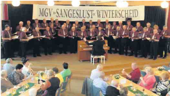
Der Männergesangsverein „Sangeslust“ Winterscheid im Haus der Begegnung in Eischeid

Einladung zum Frühlingsfest des MGV „Sangeslust“ Winterscheid am 13. Mai im Eichhof