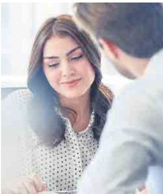
Bankkauffrau beziehungsweise Bankkaufmann zählen zu den wichtigsten Ausbildungsberufen in Deutschland.

Im letzten Jahr gab es wegen der Pandemie zehn Prozent weniger Ausbildungsverträge. Viele Betriebe suchen händeringend nach