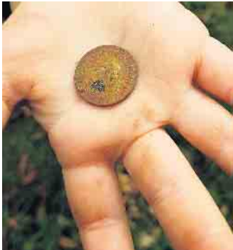
Der erste Schatz: 50 Reichspfennig

Spontan entschlossen sich zwei junge Männer aus Ruppichteroth ihren Vorsatz noch am selben Tag (23. Januar) in die Tat umzusetzen. Bewaffnet mit ihren Sonden machten sie sich an die „Arbeit“ und nach kurzer Zeit stießen sie schon auf ihren ersten „Schatz“ - eine 50-