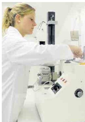
Im Labor werden die Getreidekörner auf Qualität und Beschaffenheit geprüft.

Der Müllerberuf bietet vielseitige und zukunftsichere Arbeitsplätze