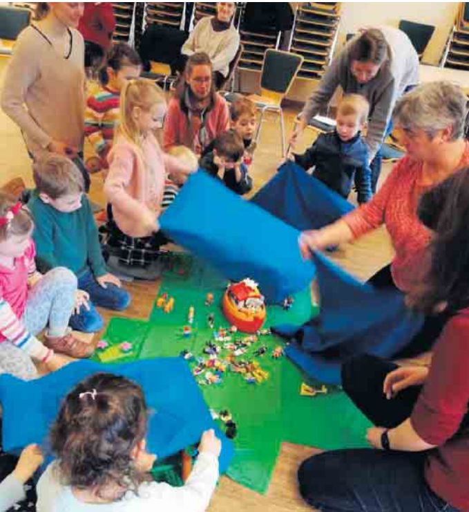
Geschichten werden gespielt

Walzenrather Str. 10, Neunkirchen-Seelscheid, Tel.: 02247-2313, Mail: kita-st-margareta@kath-nkse.de