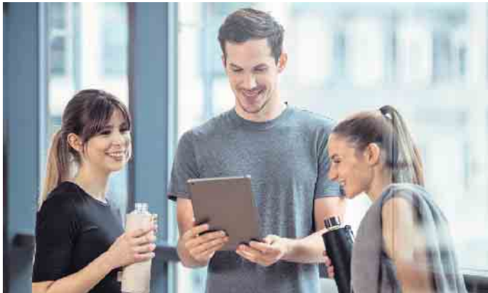
Fitnessstudios leisten einen wichtigen Beitrag zur Gesundheitsversorgung. Auch hier werden dringend Fachkräfte gesucht.

of-Science Sport-/Gesundheitsinformatik etwa qualifiziert die Absolventinnen und Absolventen, digitale Trainings-, Assistenz- und Datenverarbeitungssysteme speziell für die Sport-, Fitness- und Gesundheitsbranche zu entwickeln. (djd)