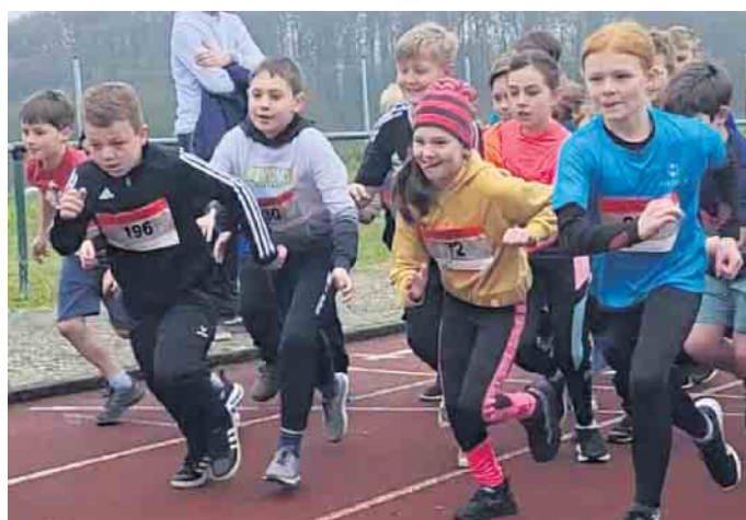
Start in der mittleren Altersgruppe der Jugend