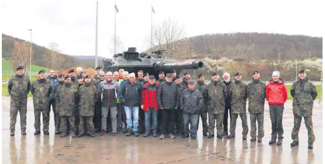
Gruppenbild mit der 3. Panzerkompanie des Bataillons 393.