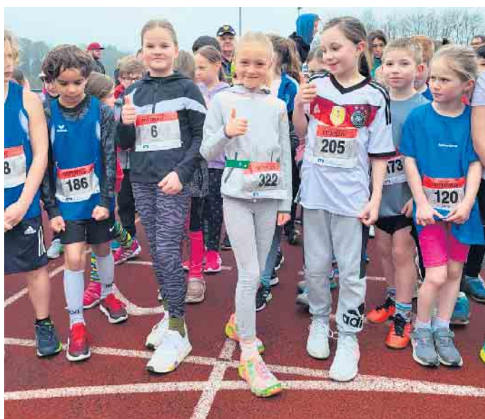
... die jüngeren Läuferinnen des TuS Winterscheid

Dieses Jahr konnten die Läufer komplett ohne Regen die Strecken bewältigen und die Stimmung auf der ganzen Anlage spornte alle Läufer an ihr Bestes zu geben. Dies ist bei den Läufen ab 5km auch stark gefordert, denn der Osterlauf in Ruppichterth weist ein starkes Höhenprofil auf. Die Kinder hingegen können auf der Tartanbahn innerhalb der Anlage laufen und können so die ganze Laufstrecke die Anfeuerungsrufe der Sportler, Eltern und Veranstalter genießen. Alle Erststarter des TuS Winterscheid waren von der Stimmung begeistert und wollen gerne wieder an Läufen teilnehmen. Wir hoffen, dass nächstes Jahr alle Starter des TuS Winterscheid an dem schönen Erlebnis erneut teilnehmen können und die Anzahl der Starter weiter gesteigert werden kann. Wer Interesse an Laufen und Laufen zusammen beim TuS Winterscheid hat, kann sich einfach melden.