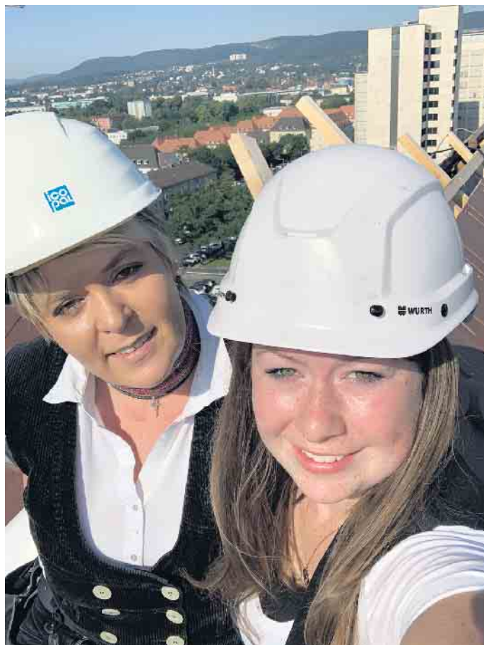
Klimaschutz, keine reine Männersache; es gibt auch Frauen im Dachdeckerhandwerk.