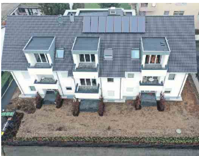
Das Dachdeckerhandwerk, der richtige Ansprechpartner für die Solaranlage auf dem Dach.

baren Veränderungen durch den Klimawandel zu begegnen, zum Beispiel der Hitzebelastung in Ballungsgebieten. „Dachdecker und Dachdeckerinnen sorgen mit ihrer fundierten Arbeit nicht nur für eine trockene und behagliche Wohnung, sondern tragen als Teil einer klimabewussten Gesellschaft mit ihrer Arbeit dazu bei, dass unsere Welt auch in Zukunft lebenswert bleibt. Denn neben der Sanierung bringen Dachdecker auch Fotovoltaikanlagen aufs Dach oder planen Gründächer. In Deutschland gibt es immerhin 120 Millionen m 2 begrünte Dachflächen. Das sorgt für Kühlung und Luftbe-