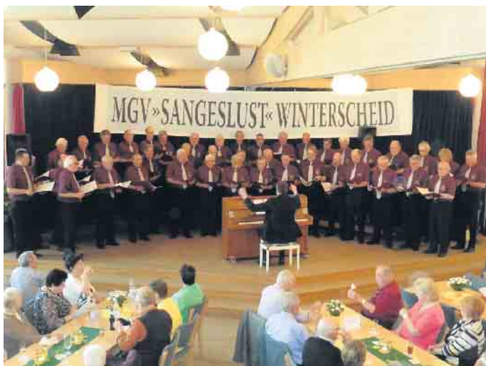
Der Männergesangsverein „Sangeslust“ Winterscheid im Haus der Begegnung in Eischeid

Coronapandemie nicht durchgeführt werden konnten, freuen wir uns umso mehr, in diesem Jahr wieder zu diesem musikalischen Hochgenuss einladen und unsere extra für dieses Fest einstudierten Gesangsstücke einem aufmerksamen Publikum vortragen zu können. Genießen Sie einen schönen Abend und lassen Sie sich bei