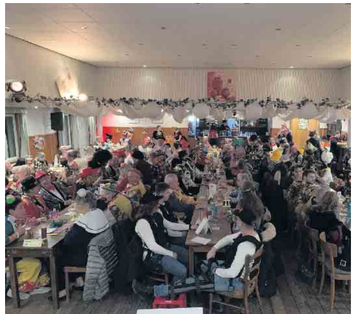
Karnevalssitzung des BMC