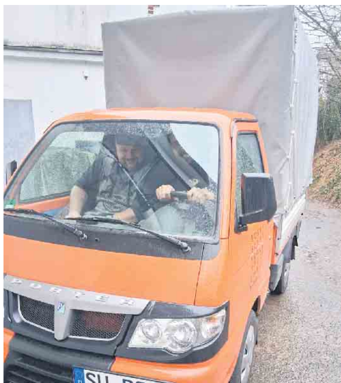
Aquarientransport.