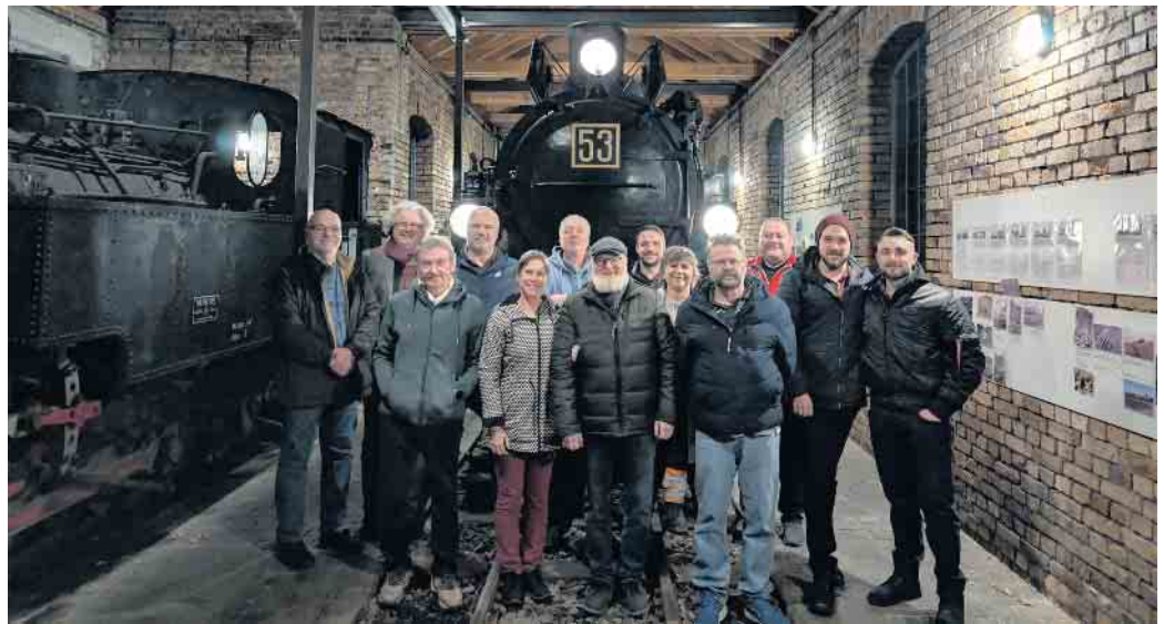
Die Gründer des Fördervereins.

Die im Jahr 1862 gegründete Bröltalbahn - später umbenannt in Rhein-Sieg Eisenbahn - war die erste öffentliche Schmalspurbahn Deutschlands und hatte bis zur