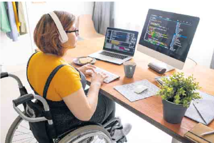
Menschen mit Behinderung können im Job genauso glücklich werden wie Nicht-Behinderte auch.