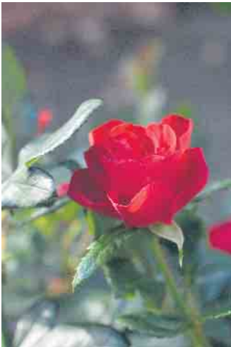
„Zepeti“ blüht dauerhaft und kommt im Gartenbeet wie ein endlos blühender Strauß daher.

Die knall-orange Neuzüchtung „Sugar Candy Rose“ ist ebenfalls ein echter Hingucker, der im Verblühen an Schönheit nicht verliert. Während sich die Blüten öffnen, entsteht ein Farbspiel, das an knallbunte Zuckerstangen erinnert und der Sorte ihren Namen verliehen hat. Wie ein gedrehter Lolly vom Jahrmarkt geht das leuchtende Orange über ins Lachs-Rosé, bis schließlich die gelben Blütengefäße der bienenfreundlichen Sorte zum Vorschein kommen. Die ganze Saison über, von Juni bis zum Frost, bringt sie eine extrem üppige Blütenpracht hervor - mit vier bis fünf Blüten an