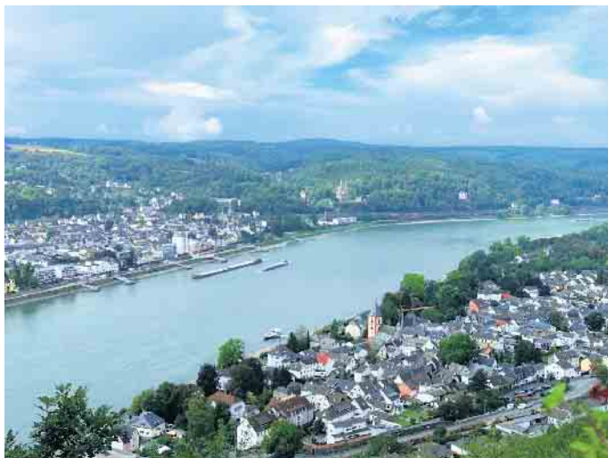
Blick von der Erpeler Ley ins Rheintal

Die aktive und „passive“ Bewegungstherapie umfasst alles, was gut tut, bis hin zu Bewegungsbädern und Massagen. Bewegung fördert nicht nur die Fitness, sondern auch die Gelassenheit, und hebt die Stim-