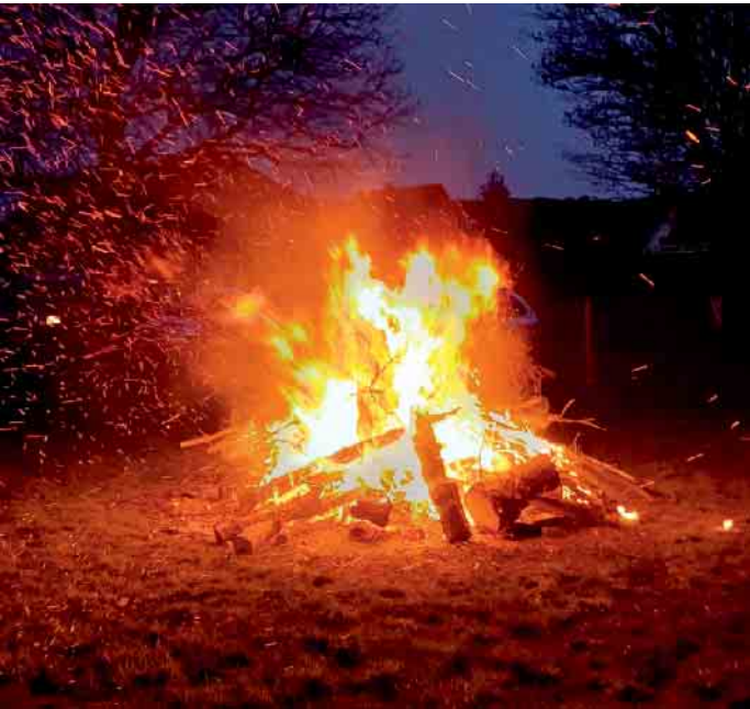
Osterfeuer auf unserem Dorfplatz

Euer Vorstand des MGV „Eintracht“ Eitorf-Halft e.V.