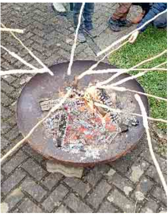
Stockbrotgrillen unserer Jüngsten

Die Berufsstarterbörse „Talente im Dialog“ wird von der Wirtschaftsförderung des Rhein-Sieg-Kreises organisiert. Unterstützt wird sie von der Kreissparkasse Köln, der Regionalagentur Bonn/Rhein-Sieg, den Wirtschaftsförderungen der Städte Hennef, Lohmar, Niederkassel, Sankt Augustin, Siegburg und Troisdorf sowie der Handwerkskammer zu Köln, der Kreishandwerkerschaft Bonn/Rhein-Sieg, der Industrie- und Handelskammer Bonn/Rhein-Sieg.