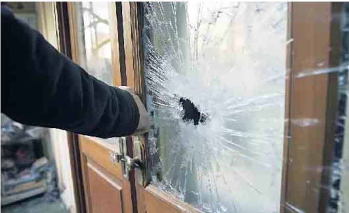
Die Zahl der Vandalismusschäden in Deutschland ist in den letzten Jahren gestiegen.

Wer im Schadenfall hilft und welche Maßnahmen sinnvoll sind