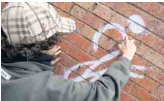
Mit Graffiti beschmierte Wände, zerstörte Briefkästen oder beschädigte Fenster und Türen: Das sind nur einige Beispiele für Vandalismus.