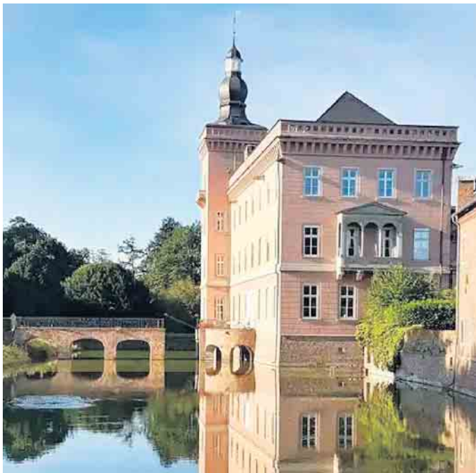
Schloss Grecht (Liblar)

sehr schönen Radwegen durchs Gelände bis nach Liblar zu dem sehenswerten Schloss Gracht, wo bis 2021 Führungskräfte und Manager ausgebildet wurden und jetzt als Klinik zur Behandlung von psychosomatischen Erkrankungen genutzt wird. Auf dem Rückweg ging es an mehreren Seen vorbei ua. am Liblarer See und Heider Baggersee in Richtung Schloss Brühl und am Wesselinger Forum vorbei am Rhein entlang bis zurück nach Mondorf. Hier erwartete uns im Café „Seeschlößchen“ zum Abschluss noch leckerer Kaffee und Kuchen. Gemeinsam in der Gruppe zu interessanten Zielen radeln,“ besser geht es nicht. Infos unter 02247/7456824 (Alfred Haas) Dies sind Informationen des Kneipp-Vereins Much und Umge-