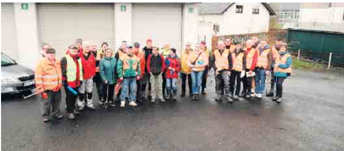
Die fleißigen Helfer*innen beim Döörper Frühjahrsputz