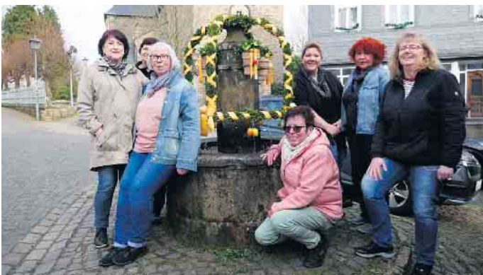
Die Moppen nach getaner Arbeit.