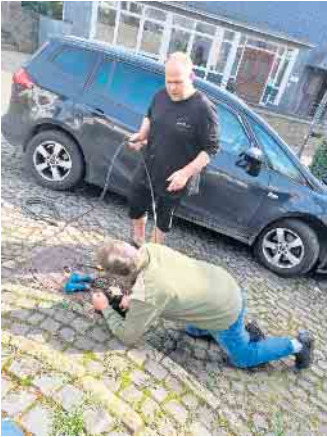
Wiederherstellung der Stromleitung am Brunnen mit vollem Einsatz