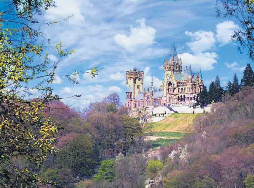
Immer wieder eine schöne Tour