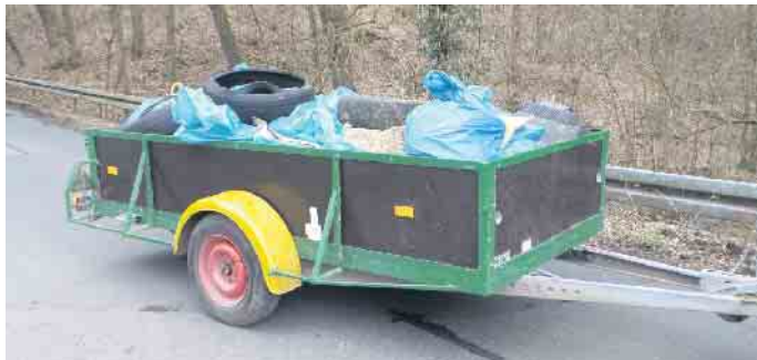
Ein ganzer Anhänger voller Müll