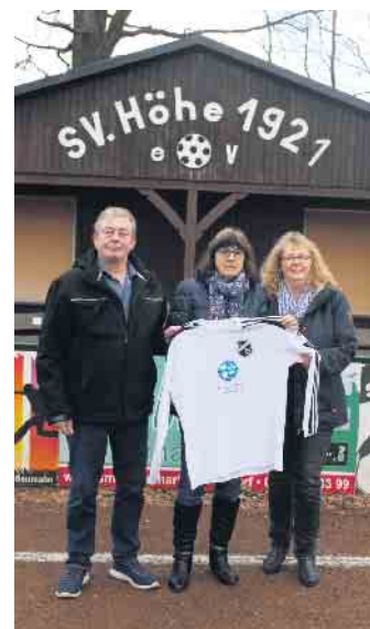
SVH-Senioren mit neuem Trikotsatz.