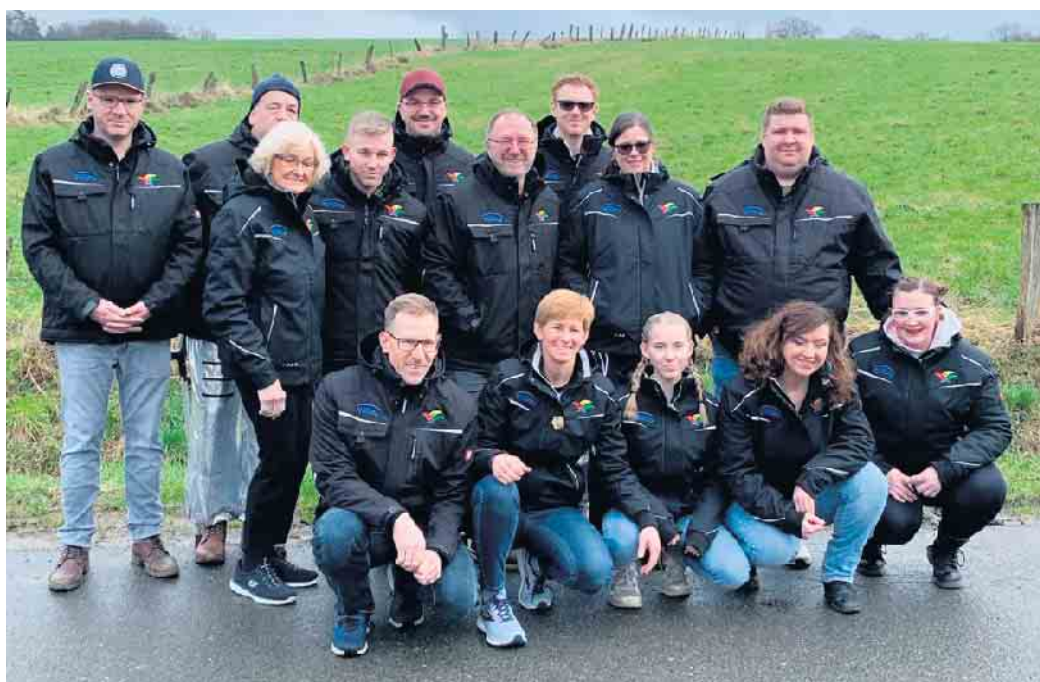
Stolz präsentiert der HKV seine neuen Jacken