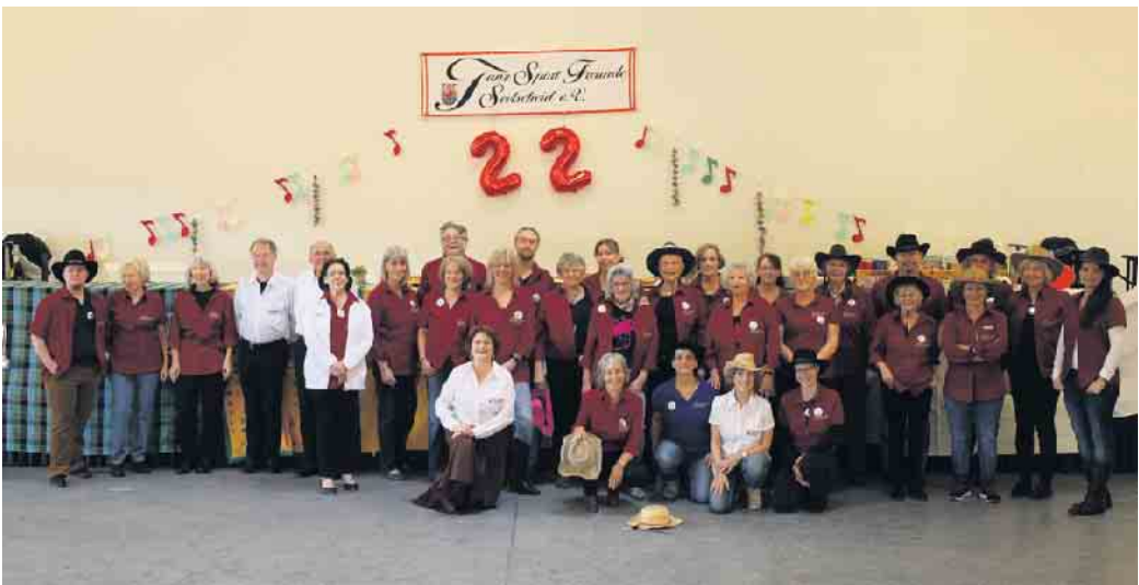
Tänzerinnen und Tänzer der TanzSportFreunde Seelscheid

Am 24. Februar war es endlich soweit. Die TanzSportFreunde Seelscheid e. V. hatten zum Tag der offenen Tür eingeladen und zu unserer großen Freude haben viele Interessierte die Einladung angenommen uns kennenzulernen und sich die verschiedenen Tanzangebote anzusehen. Nach den Vorführungen war schnell die Tanzfläche voll mit Tanzinteressierten, die Linedance, Englische Tänze und Gesellschaftstanz selber einmal ausprobieren wollten. Zur Stärkung stand ein umfangreiches Kuchen-Bufferet bereit, was viel Anklang fand. Wir möchten alle Interessierten einladen in die Trainingsgruppen zu kommen um vielleicht noch einmal intensiver zu schnuppern. Auch wer vielleicht am Samstag nicht dabei war, kann natürlich jederzeit zum Ausprobieren kommen. Die Einsteiger Linedance trainieren am Donnerstag ab 18 Uhr, Englische Tänze am Dienstag ab 20 Uhr und die Gesellschaftstänzer*innen am Sonntag ab 20 Uhr. Weitere Linedancegruppen trainieren am Dienstag ab 18 Uhr und am Sonntag ab 17.30 Uhr. Linedance findet zur Zeit aus or-