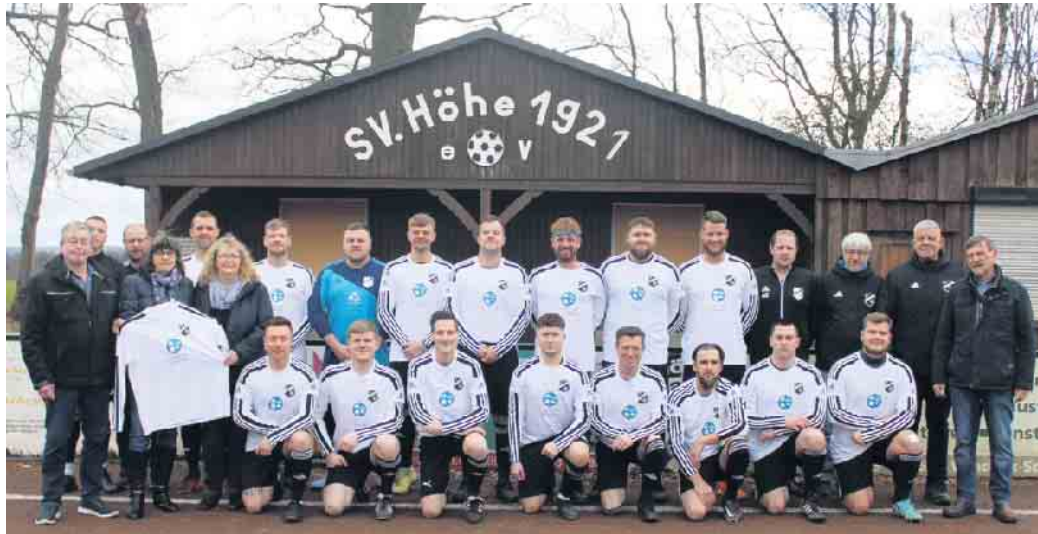
SVH-Senioren mit neuem Trikotsatz.

SVH I - TuS Schladern I 3:4 (1:1) Gegen den Meisterschaftsanwärter aus Schladern entwickelte sich anfangs ein ausgeglichenes Spiel mit ein paar Chancen auf beiden