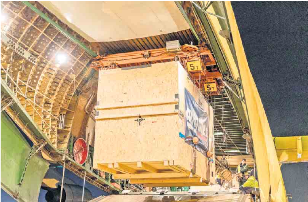
In der Holzpackmittelindustrie werden alltägliche Produkte, aber auch besonders große, schwere und empfindliche Güter sicher verpackt.

„Darüber hinaus können alle Teilnehmer den Staplerschein machen. Damit kann man in unserer Branche flexibel und in vielen Bereichen arbeiten“, erklärt der Packmittelexperte abschließend. „Neben technischen Schulungsinhalten wird auf die Vermittlung der eigenen Qualitätsstandards