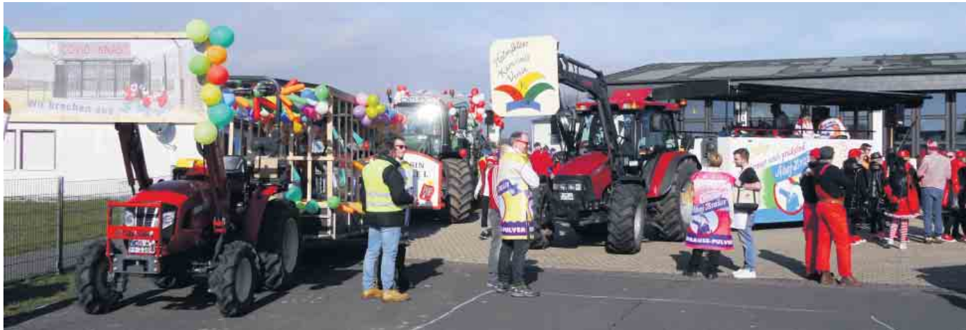
Die Zugaufstellung bei bestem Wetter am Feuerwehrhaus

Nach einem weiteren Rosenmontagszug mit vielen strahlenden Kinderaugen, feierwütigen Erwachsenen und bestem Wetter sagen wir ein herzliches Dankeschön an alle Teilnehmer und Unterstützer. Ohne Euch wäre ein solch schöner Zoch nicht möglich gewesen. Wir haben