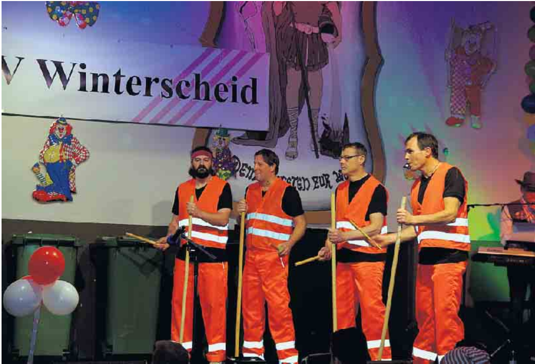
Die „Gelben Säcke“