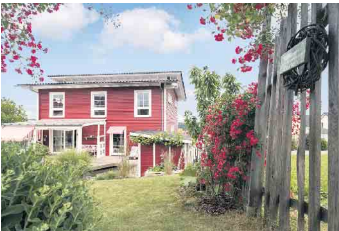
Wohlfühlwohnen gelingt in einem individuell geplanten Holz-Fertighaus sicher.

einer schlüsselfertigen Bauausführung der Haushersteller, die Baufamilie braucht nach der Bauabnahme nur noch einzuziehen. Das heißt, sie hat während der Bauphase alle Freiheiten, ihren Alltag wie gewohnt fortzuführen und zudem genügend Freizeit, den Umzug vorzubereiten. „Mit einem schlüsselfertigen Fertighaus kommt weniger Stress auf - und ist der Umzug erst einmal gemeistert, lässt es sich in einem regionaltypisch inspirierten Holz-Fertighaus mindestens so gemütlich wohnen wie im Urlaub in Schweden oder am Mittelmeer“, ist Tews überzeugt. (BDF/FT)