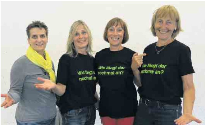
Mitglieder einer Linedance Gruppe

Ihr kennt die TanzSportFreunde noch nicht? Aber vielleicht habt Ihr ja schon mal daran gedacht selber zu tanzen? Dann ist das Euer Termin. Egal für welche Tanzrichtung Ihr Euch interessiert: Linedance, Englische Tänze oder Gesellschaftstanz. All das könnt Ihr beim Tag der offenen Tür kennenlernen. Es gibt Vorführungen in jeder Tanzart und dann könnt Ihr in einem kleinen Workshop diese Tänze selber ausprobieren. Egal ob Ihr oder als Paar tanzen möchtet, alles ist möglich.