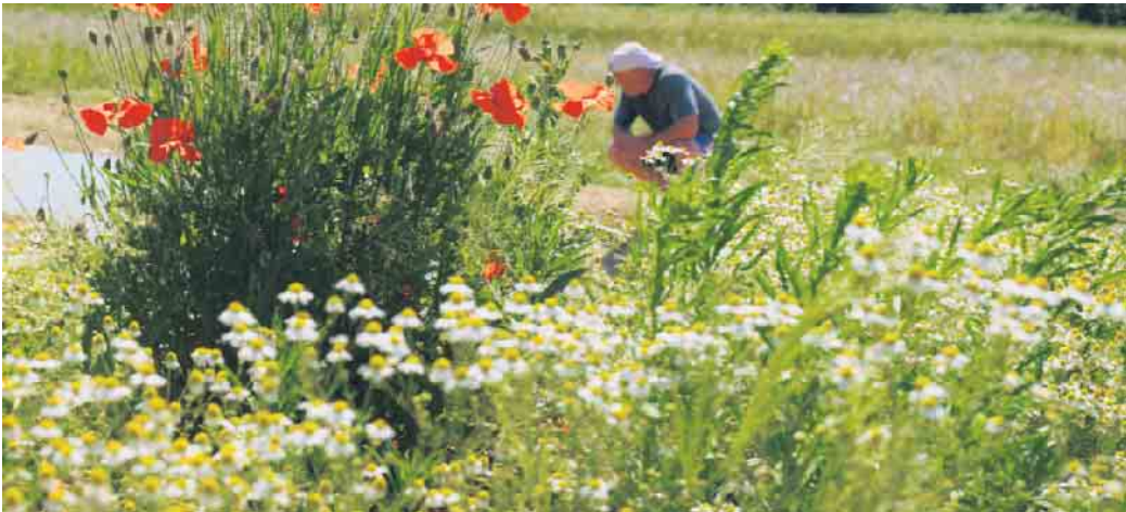
Naturoasen in der Grünen Mitte.

Die WDR Naturdokumentation führt zu einzigartigen und faszinierenden Naturoasen in NRW. So auch in die Grüne Mitte von Sankt Augustin. Der Film von Jürgen Brügger, Jörg Haaßengier und Gerhard Schick erzählt von Menschen, die sich