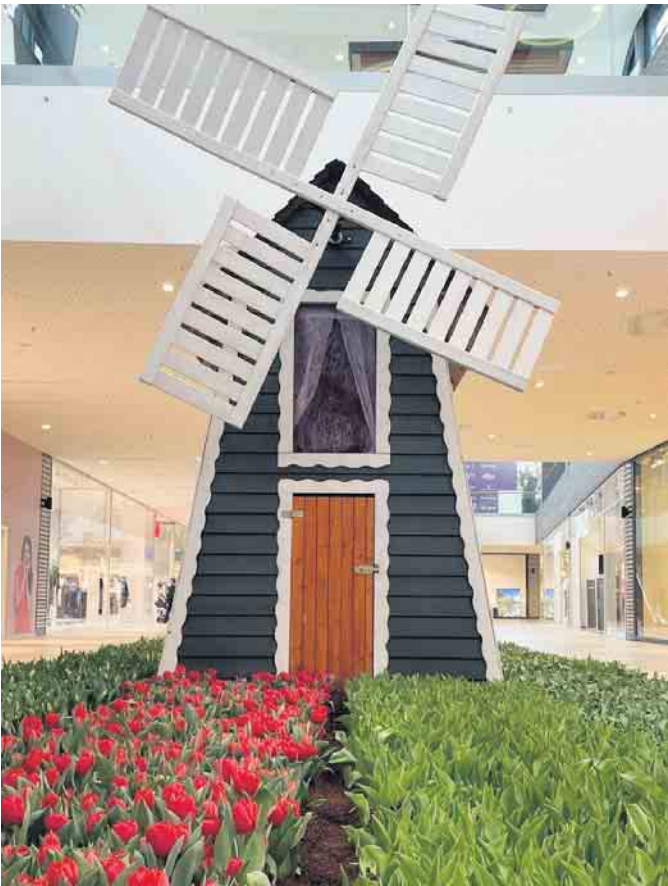
Vorboten des Frühlings: Unsere Blumendeko brachte im Februar Farbe ins Center!

Mieten statt kaufen: Bei SATURN können Sie ab sofort viele technische Geräte mieten.