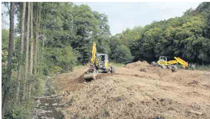
Laufende Gewässerrenaturierung im Krabachtal (Hennef).

Besonders hervorzuheben ist der 2023 geschlossene Vertrag zwischen der Stadt Bad Honnef und dem Rhein-Sieg-Kreis. Dieser regelt die Wiederbewaldung mit Laubbaumarten, den Nutzungsverzicht und die Flächenstilllegung Flächenstilllegung sowie den Erhalt und die Erweiterung von Offenlandbiotopen auf insgesamt 150 Hektar Waldfläche. Die im Pflege-