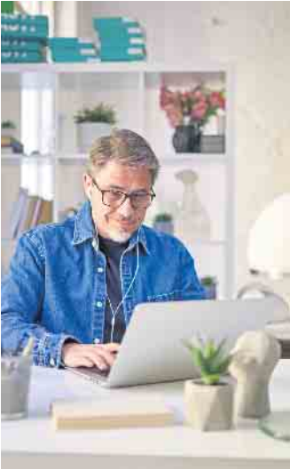
Dank Live-Online-Unterricht können die Weiterbildungsangebote aus den Bereichen Energie und Umwelt auch von zu Hause oder im Büro genutzt werden.