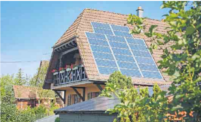
Eine neue Studie untersucht Schäden und Planungsfehler bei Photovoltaikanlagen und gibt Hinweise, wie man diese vermeiden kann.

BSB-Sprecher Stange betont: „Die Ergebnisse unserer Studie zeigen, dass viele Fehler von Beginn an vermeidbar sind.“ Er verweist darauf, dass ein Gutteil der Probleme bereits in der Planungsphase entsteht, zum Beispiel durch eine falsche Auslegung oder einen unsachgemäßen Einbau. Typisch sind etwa Verschattungen durch andere Gebäude oder hohe Bäume bei der tief stehenden Wintersonne, eine nicht fachgerechte Dachmontage, die zu Feuchteschäden führen kann, oder fehlerhafte Steckverbindungen, die schlimmstenfalls einen Brand auslösen können. Laut Stange sind Hausbesitzer gut beraten, wenn sie die Montage der PV-Anlage von einem unabhängigen Experten prüfen lassen. Denn „sachverständige Begleitung und regelmäßige Wartung sind Schlüsselpunkte für eine langfristig sichere und effiziente Nutzung“, so Stange. (DJD)