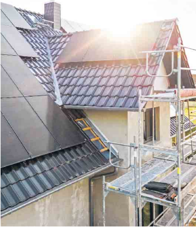
Laut einer aktuellen Studie entstehen viele Probleme an Photovoltaikanlagen durch Fehler bei der Planung und bei der Installation.

Email: info@metallbau-soentgerath.de Web.: www.metallbau-soentgerath.de