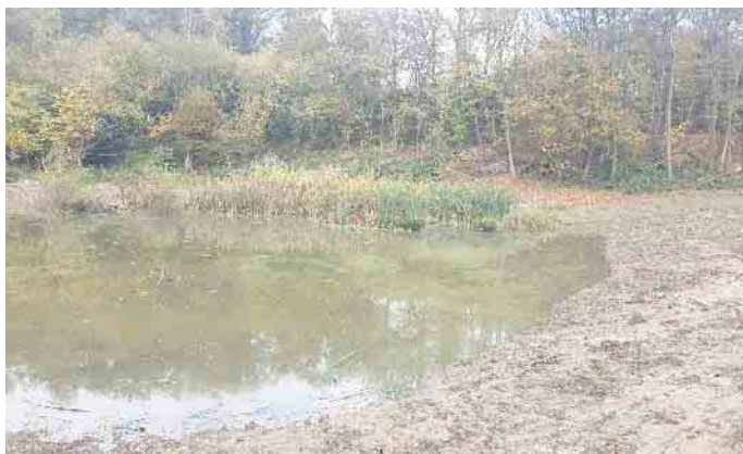
Renaturierte ehemalige Fischzuchtanlage am Quirrenbach in Königswinter mit der Wiederherstellung eines naturnahen Amphibiengewässers.

und Entwicklungsplan gesteckten Ziele zur Waldentwicklung im Siebengebirge konnten mit dem Vertrag erreicht werden.