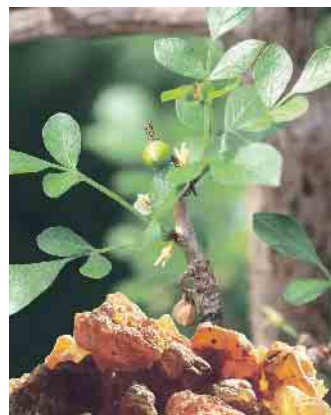
Myrrhe für einen starken Darm.

So wirken z.B. pflanzliche Kombinationsarzneimittel mit Myrrhe gegen drei Leitsymptome des Reizdarms - Blähungen, Krämpfe, Durchfall - und haben darüber hinaus einen stabilisierenden Einfluss auf die Darmbarriere. Die Darmwand ermöglicht unserem Körper die Nahrungs- und Flüssigkeitsaufnahme aus dem Darminhalt, muss aber auch das Eindringen von gefährlichen Bakterien verhindern. Einige schädliche Bakterien, Medikamente, Alkohol oder Nikotin können die Darmbarriere schädi-