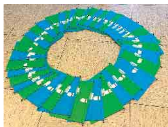
Hier steckt jede Menge Arbeit drin