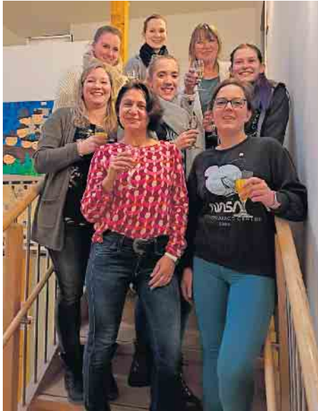
Das Team ist stolz auf seinen Erfolg

So sprach sie davon, dass sie viele positive Eindrücke und Ideen für andere Kitas mitnehmen würde und lobte unser gut aufgestelltes Team, das in besonderer Weise die Bedürfnisse der Kinder wahrnimmt und gut guckt, was die Kinder in den verschiedenen Altersstufen brauchen. Positiv be-