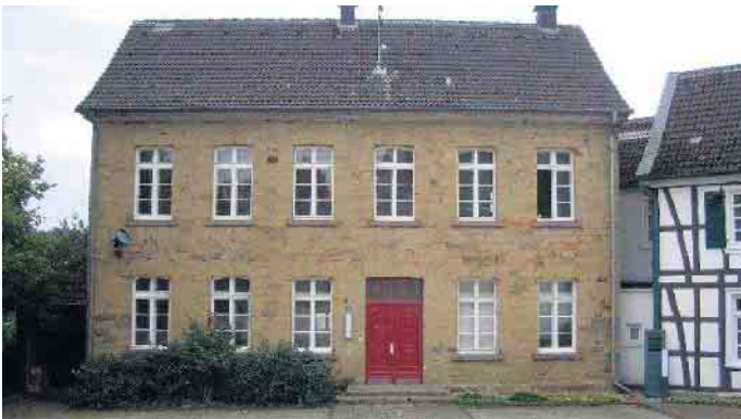
Café Alte Schule

Das Team Café Alte Schule Anmeldung unter: Tel.: 02295 / 5214 (Gemeindebüro)