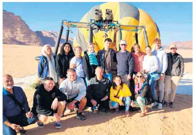
Ballonfahrt im Wadi Rum