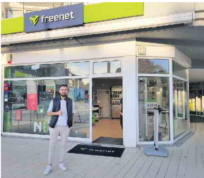
Im freenet Shop Rösraht gibt es alles rund um das Handy.

Rösraher Vereinigung begrüßt freenet Shop