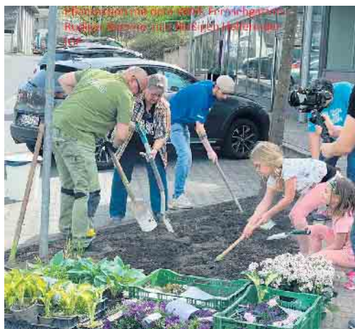
WDR, Ramme und IGF Pflanzaktion.

Eiscafe ein (bei kostenlosem Glühwein finden Sie eine Überraschung hinter dem 13. Türchen) zum „ Lebendigen Adventskalender “ am 13. Dezember, 17.30 Uhr