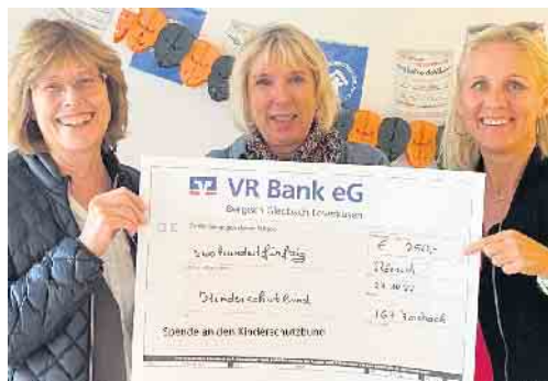
Spendenübergabe an Kinderschutzbund

Kindern fantasievoll geschmückt. Um dem IGF Motto „my Dorf is my Castle“ weiter gerecht zu werden, planen wir für die Bürger/innen einen Wochenmarkt am Halfenhof. Es werden weitere Ruhebänke aufgestellt werden. Die Weihnachtsbeleuchtung „Sterne“ über Forsbach dürfen wir leider wegen der Strom- und Gaskrise in diesem Jahr nicht aufhängen, dafür leuchtet der Halfenhof 2022 weihnachtlich. Und die IGF lädt dort vor dem