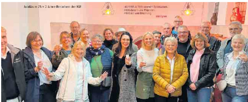
25 Jahre IGF mit Mitgliedern

Im Jahr 1995 beschlossen einige Gewerbetreibende in Forsbach ihren Ort durch eine neue Attraktion aufzuwerten und für die Bürger:innen für den Einkauf interessant zu gestalten. Daraus entstand im Laufe der Jahre das XXL-Sommerfest in Verbindung mit der Waldbeerkirmes. Coronabedingt konnten die Mitglieder erst 2022 das Jubiläum 25 + 2, mit der Besichtigung der Brennerei Hofferhof begehen. Vieles hat sich verändert im Laufe der Zeit, das Engagement der IGF für Forsbach hat sich jedoch verstärkt: Ruhebänke im Ort wurden aufgestellt, Einnahmen aus Aktionen kamen immer dem Ort wieder zugute, sei es Material für die Grundschule, die Kindergärten, Juze, dem Kinderschutzbund uva.