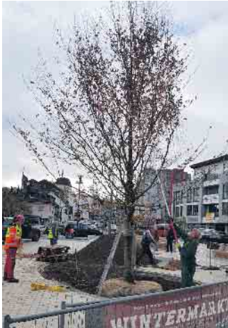
Pünktlich zum Wintermarkt wurde die neue Sülztalplatz-Blutbuche errichtet.

Blickfang und Schattenspender im Rösraher Stadtzentrum