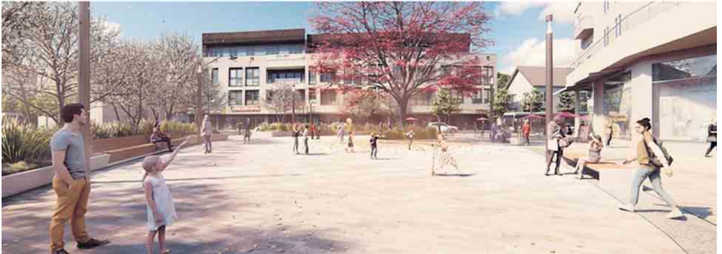
Der Solitärbaum prägt die Platzumgebung im Ortszentrum.

Mit dem Rösrahter Wintermarkt werden der neugestaltete Sülztalplatz und die neue große Blutbuche auf dem Platz eingeweiht