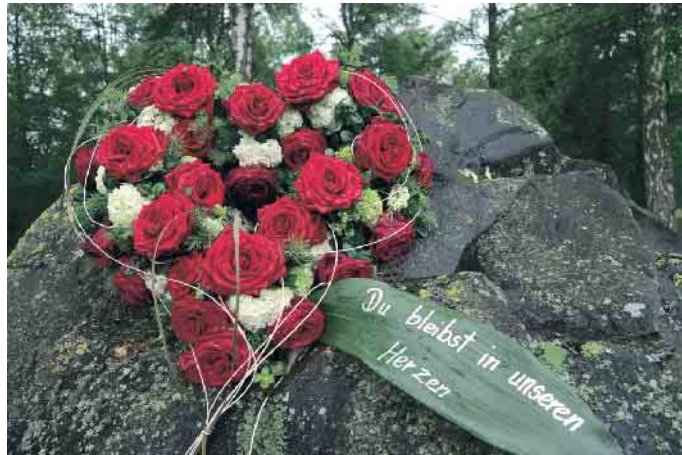
Gedenken Blumenherz.

Früher waren Krankheit, Sterben und Tod in der Großfamilie unter einem Dach vereint, genauso wie Romanze, Heirat und Geburt. Heute haben viele Menschen nie lernen und auch nie erfahren können, was Sterben und Tod bedeuten und wie sie von einem geliebten Menschen Abschied nehmen und richtig trauern können. Hinzu kommt, dass viele Angehörige nicht oder nicht mehr an dem Ort arbeiten, an dem sich das Grab befindet. In letzter Zeit kommt Corona mit den Kontaktbeschränkungen hinzu.