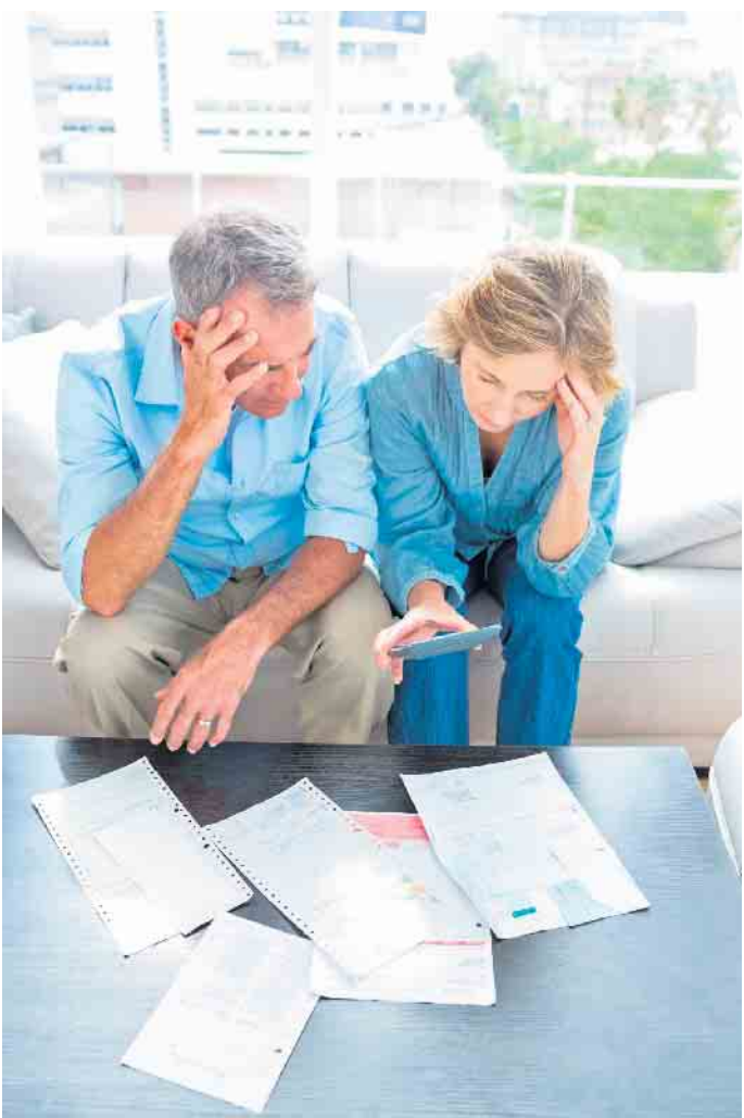
Bauherren sollten sich vor der vertraglichen Bindung mit einem Hausbauunternehmen ein genaues Bild über die voraussichtlich anfallenden Nebenkosten machen - sonst kann es schnell ein böses Erwachen geben.

schen drei und sieben Prozent des Kaufpreises als Courtage. Seit Ende 2020 wird die Maklerprovision beim Immobilienverkauf zwischen Käufer und Verkäufer geteilt. Vorher hatten Käufer den Großteil der Maklergebühren getragen. 3. Bei einem Neubau sind Planungs-, Erschließungs- und Vermessungskosten ein erheblicher Teil der Baunebenkosten. Dazu zählen beispielsweise auch Ausgaben für Prüfstatiker und Baugrundgutachten sowie die Kosten für die Verlegung der Hausanschlüsse. Sinnvoll ist es, während der Bauphase auf die baubegleitende Qualitätskontrolle durch einen Sachverständigen zu setzen - dessen Arbeit kostet ebenfalls Geld. 4. Besonderes Augenmerk sollte auch auf die Erdarbeiten gelegt werden. Darunter fallen Aushub, Abtransport des Aushubs und Verfüllarbeiten. Diese Arbeiten sind nicht immer vollständig im Angebot enthalten. Es ist ratsam, genau zu prüfen, welcher Umfang abgedeckt ist - und mit welchen zusätzlichen Kosten gerechnet werden muss. 5. Auch Versicherungen können in der Summe ins Geld gehen: Zu den potenziell notwendigen Versicherungen eines Bauherren gehören die Bauherrenhaftpflicht, die Bauleistungsversicherung, die Bauhelferunfallversicherung und die Baufertigstellungsversicherung. Die