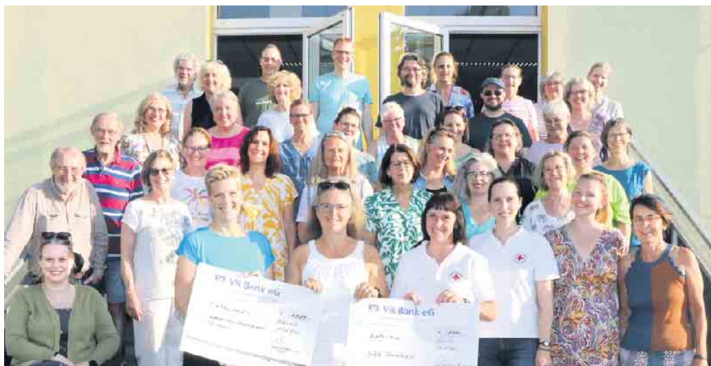
Scheckübergabe an den Hospizdienst Rösrath und das DRK Rösrath

Beide Organisationen leisten wertvolle Arbeit für die Gemeinschaft. Das DRK Rösrath ist unter anderem in der Notfallhilfe, Ersten Hilfe und im Sanitätsdienst aktiv und steht Menschen in schwierigen Lebenssituationen zur Seite. Der Hospizdienst Rösrath betreut Menschen und ihre Angehörigen mit Empathie und