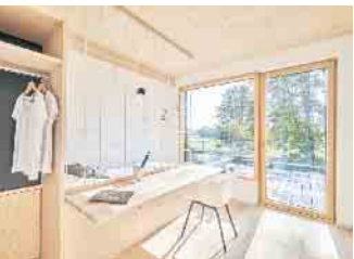
Offene Grundrisse und viel Tageslicht lassen auch kleine Wohnflächen großzügig wirken - funktional geplant entsteht hoher Komfort auf kompaktem Raum.

ten zu sparen, ohne Einbußen bei Wohnqualität und Gestaltung. „Die Fertigbauweise bietet hierzu optimale Voraussetzungen“, so Achim Hannott. Bundesverband Deutscher Fertigbau e.V.