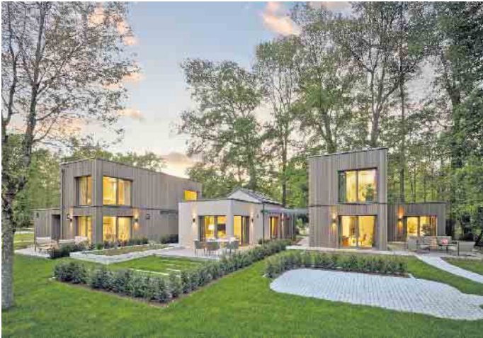
Kleine Fertighäuser überzeugen mit klarer Architektur, effizienter Bauweise und einer ansprechenden Optik.

Kompakt Wohnen bedeutet keinen Verzicht, sondern es bietet eine Chance: Auf das Wesentliche reduziert und funktional durchdacht helfen kleine Häuser, Kos-