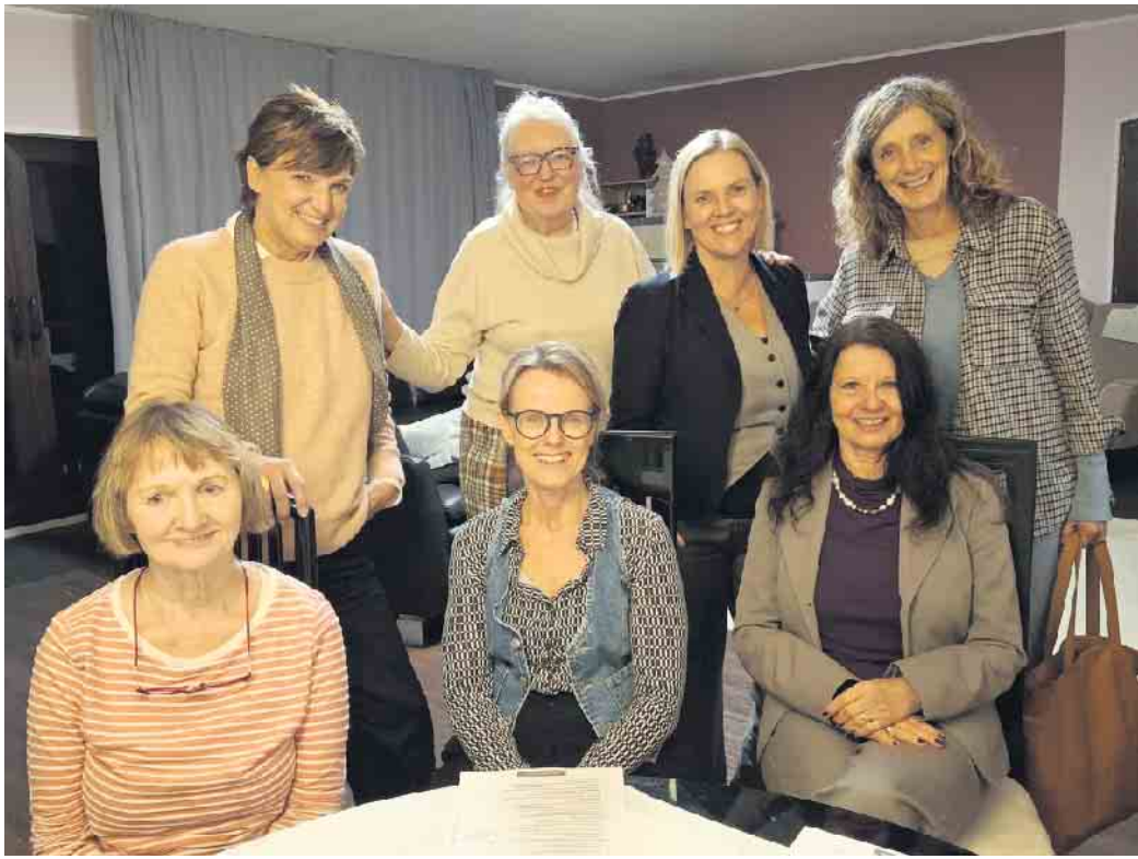
Interessanter Diskussionsabend rund um das Thema Tod und Vorsorge.