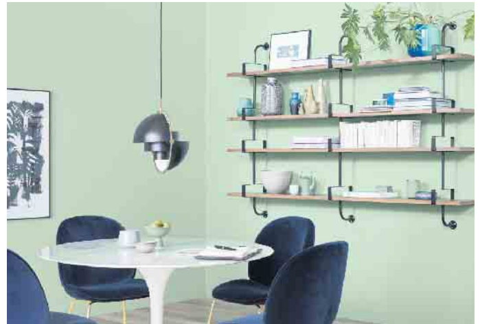
Mehr Mut zur Farbe: Das kreative Kombinieren von Wandfarben, Bödenbelägen und Möbeln verleiht dem eigenen Zuhause mehr Ambiente.

Wer hingegen kräftige Farbakzente setzen will, ist mit den „fruchtigen“ Tönen Amarena, Mango oder dem satten,