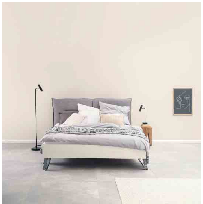
Eine Alternative zu immer nur weißen Wänden: Die Trendfarbe Cosy steht für entspannte Gelassenheit.