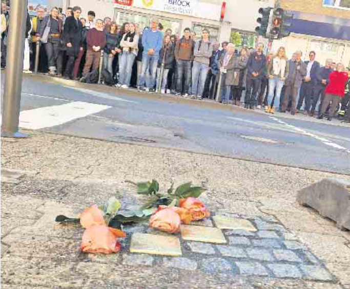
Im Rahmen der Verlegung wurde der Opfer in einer Schweigeminute gedacht und durch Wort- und Musikbeiträge an sie erinnert.