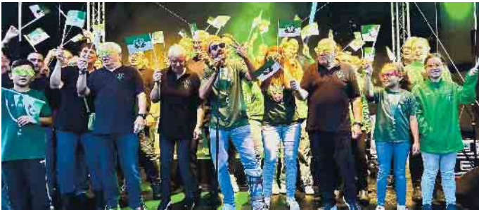
Super Stimmung auf der Bühne.