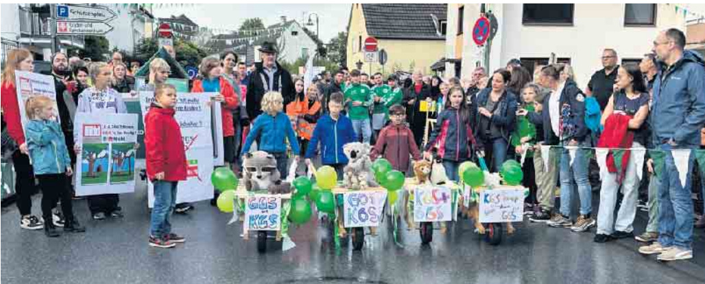
Spannende Läufe.