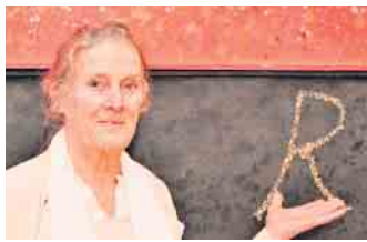
Mary Bauermeister 2017.