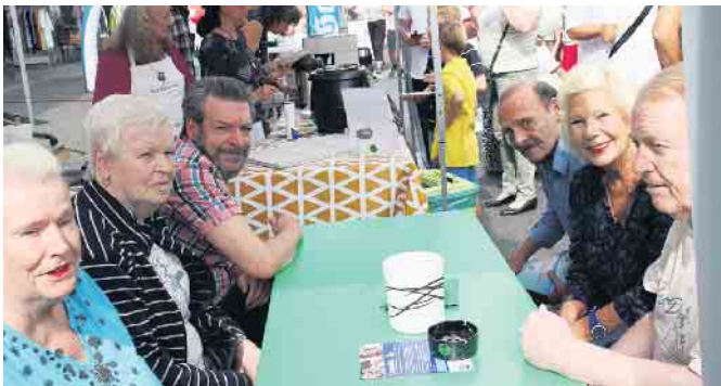
Die Bewohner*innen von Haus Kleineichen warten auf ihre Waffeln

SPENDENKONTO: UZUNDU Förderverein e.V. IBAN: DE92 3705 0299 0141 2748 92 BIC: COKSDE33