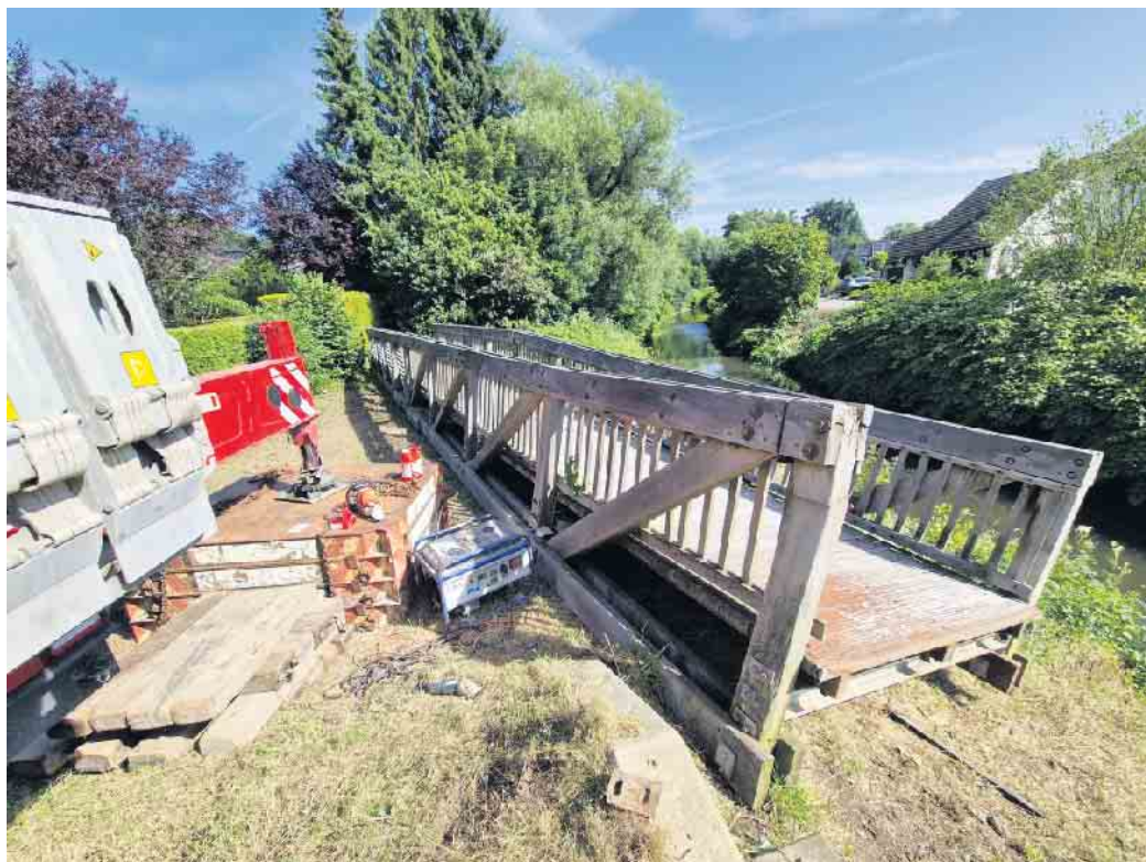
Die alte Brücke In den Schlämmen wurde mit Hilfe eines Krans entnommen und nun am Uferbereich in Einzelteile zerlegt, um anschließend fachgerecht entsorgt werden zu können.

Der unmittelbare Bereich rund um die Widerlager der alten Brücke bleibt auf beiden Uferseiten bis zum Einbau der neuen Brücke weiterhin gesperrt. Ursprünglich sollten Abriss und Neubau der Brücke in einem Zug stattfinden. Der Abriss musste nun aber vorgezogen werden, da die Brücke zuletzt weiter an Substanz verlo-