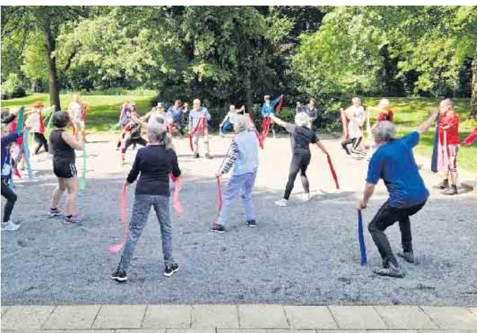
Sport im Park auf dem Bouleplatz in Hoffnungsthal

der Muskulatur im Einsatz ist. Gleichzeitig wird die Ausdauer, Kraft, Koordination und Beweglichkeit trainiert und bei regelmäßiger Ausübung stetig verbessert. Für alle Angebote wird bequeme Freizeit- und Sportbekleidung empfohlen, da es keine Möglichkeit gibt, sich vor Ort umzuziehen. Auch etwas zu trinken sollte jeder mitbringen. Die Angebote