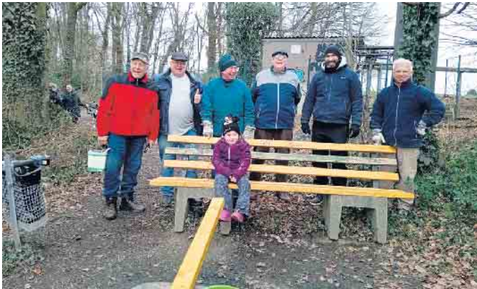
Bank“ bemalt. An einem Samstag haben sich ein paar Männer des Dorfes getroffen, um die Bänke zu erneuern. Das Ergebnis kann sich sehen lassen. So geht Dorfgemeinschaft!

Im Rösrather „Lüghäuser Bankenviertel“ sind zwei Bänke willkürlich bemalt, kaputtgetreten und mit der Zeit marode geworden. Bei einem Zusammensein mit den Dorfbewohnern wurde über dieses Thema gesprochen. Die Bänke werden von Wanderern sehr gern genutzt, da man schön den Wald, die Stadt Rösrath und in der Ferne Bonn sowie Köln erblicken kann. Wir haben einen Sponsor gefunden, der uns die Bohlen geschenkt hat. Diese wurden dann lasiert und mit dem Schriftzug „Lüser