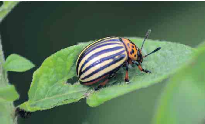
Nicht nur an Kartoffelpflanzen richtet der nach ihnen benannte Käfer Schaden an.

lässt aber auch einen unansehnlichen Rasen. Schlauer ist es, Nematoden zu sprühen. Nematoden - die winzigen Gartenhelfer: Nematoden sind Fadenwürmer, die sich als Parasiten in Insektenlarven niederlassen. Mit dem Gießwasser gelangen sie in den Boden. Clever: Der AquaNemix von Birchmeier (birchmeier.com) wird an den