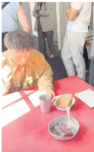
Ein Teil der Dauerausstellung: Ein polnischer Soldat mit einer typischen Tagesration.

Umso erfreulicher ist es, dass der ehemalige Lagerstandort heute durch ein dem Gemeinwohl verpflichtetes Pädagogisches Zentrum für Kinder und Familien genutzt wird, dessen Geschichte ebenfalls Thema der Ausstellung ist.