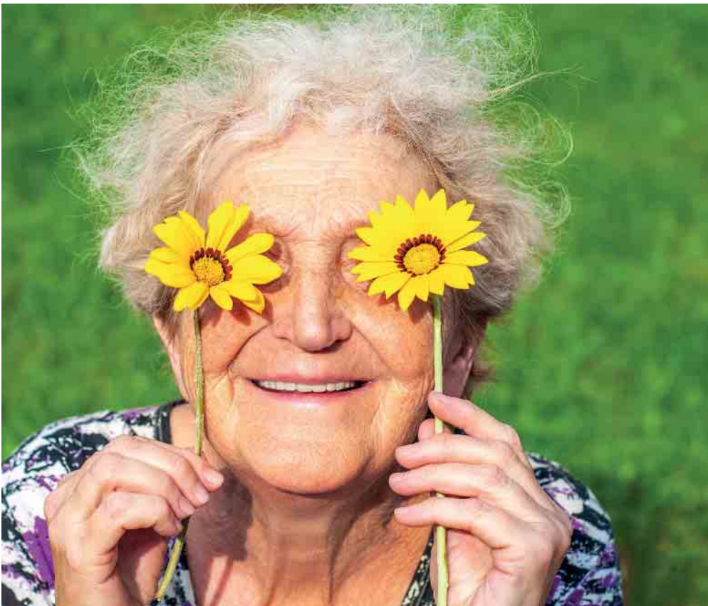
Der Frühling bringt Freude in die Herzen

Die Mitarbeiter und Bewohner*innen von Haus Kleineichen wünschen Ihnen, liebe Leserinnen und Leser, heitere Tage – und dass viel Wärme Sie umgibt!