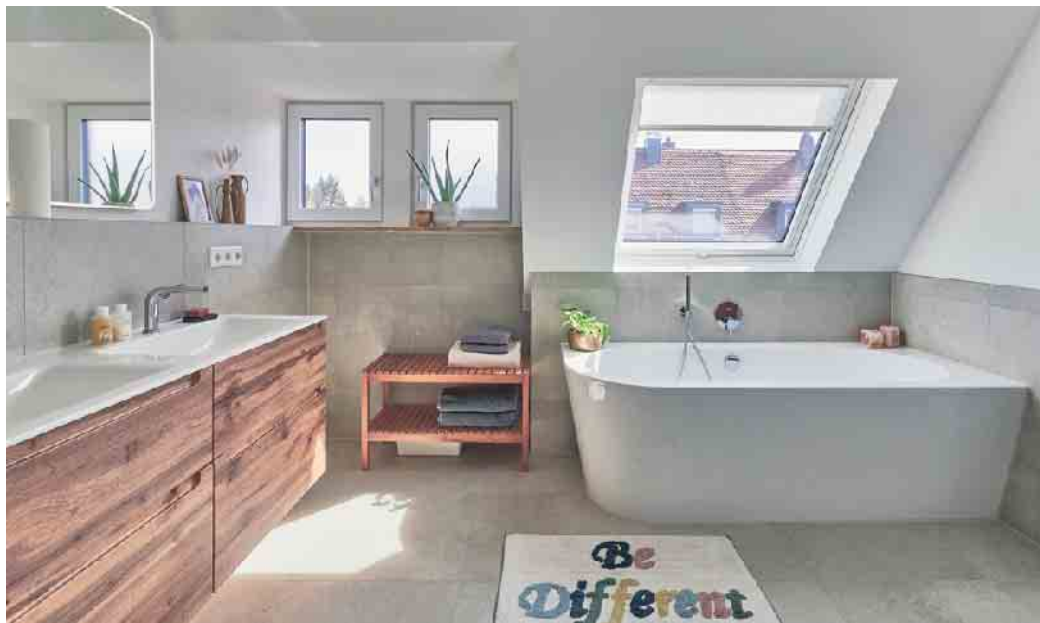
Dachfenster (rechts) und Gaube (links) in diesem Badezimmer zeigen den Unterschied: Während durch die Gaube mehr Wohnfläche mit voller Stehhöhe gewonnen wird, sorgt das Dachfenster für einen deutlich höheren Tageslichteinfall.

Da eine Gaube ein aufwendiger Aufbau auf dem Dach ist, ist die fachmännische Installation, Dämmung und Eindeckung notwendig. Dadurch ist der Einbau von Dachfenstern in der Regel günstiger. Sie